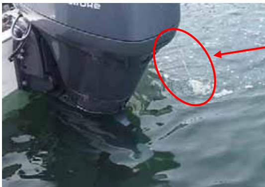
冷却水排出状況(船外機)

エンジンの冷却水排出量、勢いはいつもと変わりありませんか フィルターの目詰まりがなければ冷却水ポンプのインペラ（羽根車）が不良の 恐れがあります 定期的に確認し不良の場合は交換しましょう