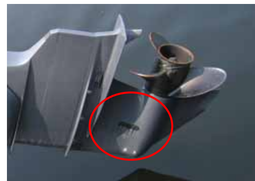
冷却水取入口（船外機）