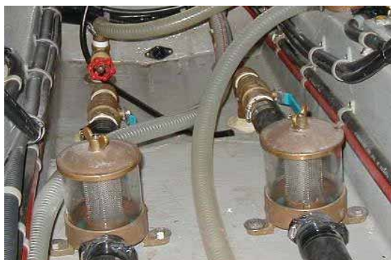
冷却水用フィルター

（海上で作業する場合、冷却水取入弁（キングストンバルブ）等を閉鎖して作業しましょう）