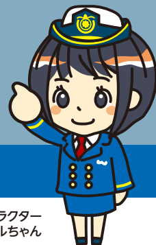
海難防止イメージキャラクター ハルちゃん