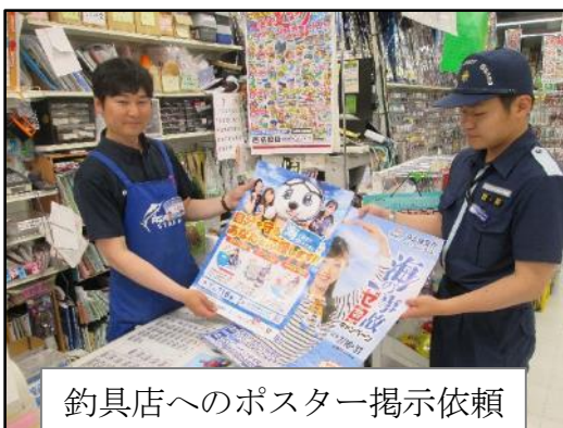
釣具店へのポスター掲示依頼