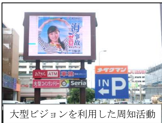
大型ビジョンを利用した周知活動