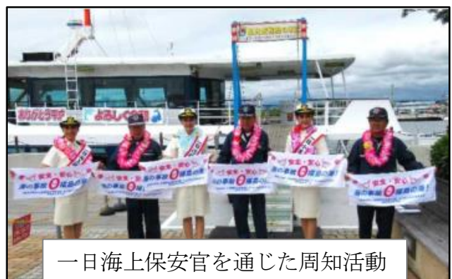
一日海上保安官を通じた周知活動