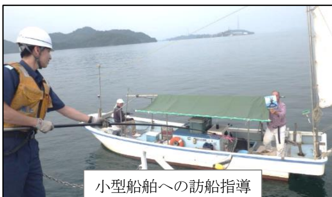
小型船舶への訪船指導