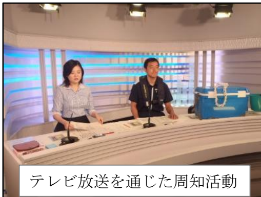
テレビ放送を通じた周知活動