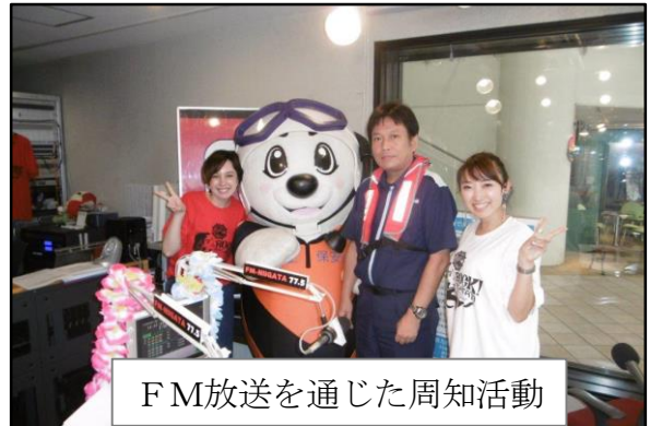
F M放送を通じた周知活動