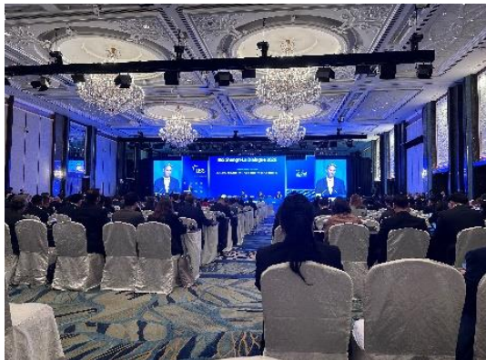
プレナリーセッションの様子