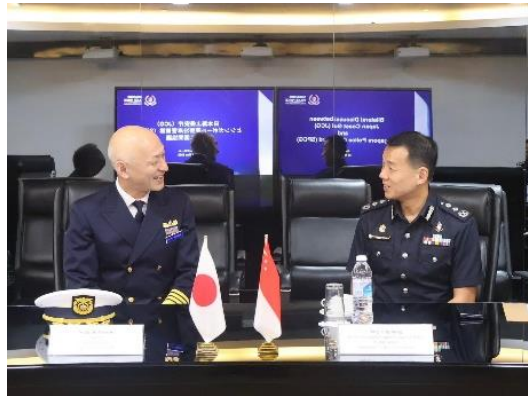
バイ会談(シンガポール警察沿岸警備隊)