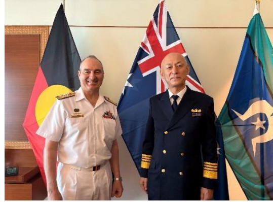
バイ会談(オーストラリア国防省)