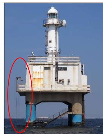
千葉灯標に設置したモニタリングポスト (図中赤線内)