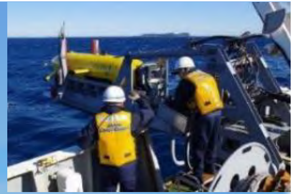
自動で潜航して海底地形等を調査する観測機器の投入作業