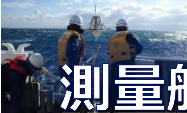
泥などの海底堆積物を採取する機器の投入作業