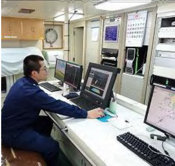
観測データの解析作業