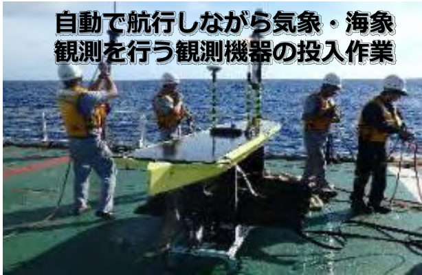
自動で航行しながら気象・海象観測を行う観測機器の投入作業