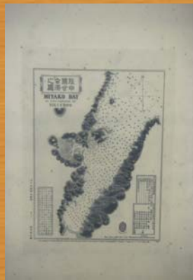
■陸中國宮古港之圖(明治5年)