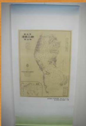
■豊後國猪之串港略測圖 (明治10年)