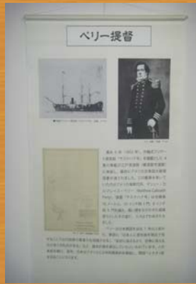
■ペリー提督の説明