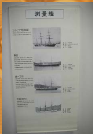
■明治初期に使用した測量艦