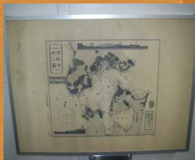
■津軽海峡之圖(明治6年)