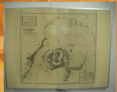
■薩隅内海之圖 (明治7年)