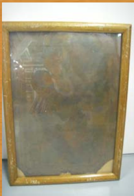
■陸中國宮古港之圖(銅版(印刷の原版))