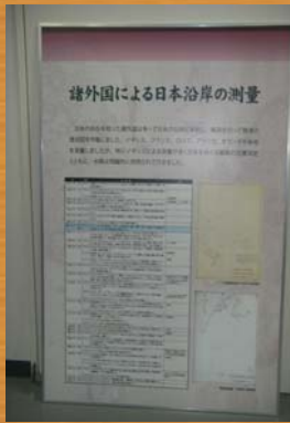
■日本における海図作成の変遷