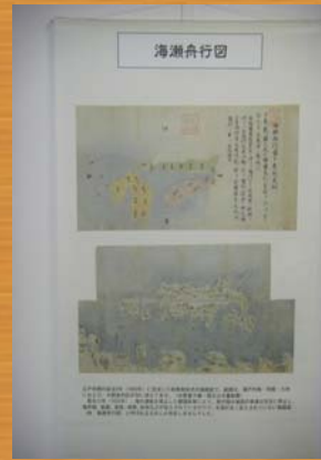
■海瀬舟行図(江戸時代の海図)