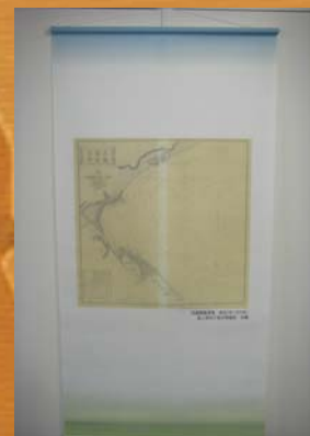
■武蔵國横濱灣圖(明治7年)