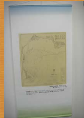
■武蔵國東京海灣圖(明治6年)