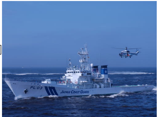
巡視船艇・航空機