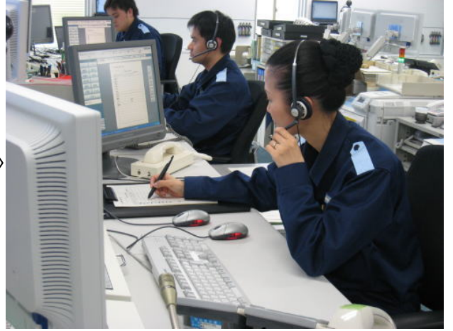
運用司令センター