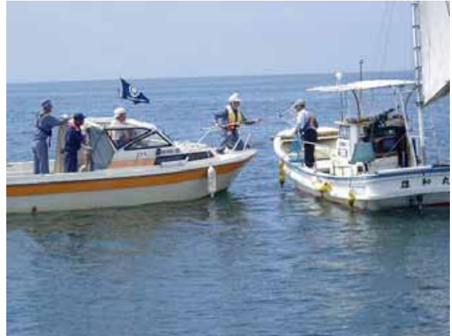
海上安全指導員との合同パトロール