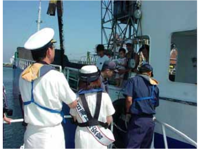
一日海上保安官による海難防止の呼びかけ