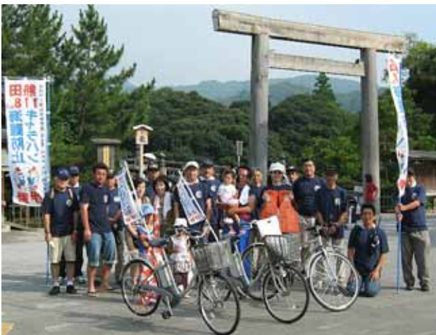
海難防止キャラバン