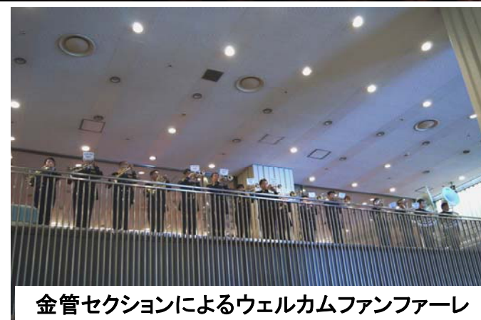
金管セクションによるウェルカムファンファーレ