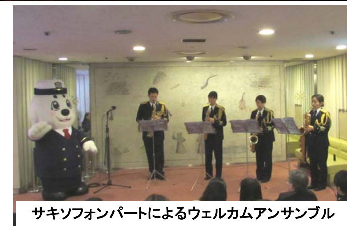
サキソフォンパートによるウェルカムアンサンブル

11月9日(土)、海上保安庁音楽隊は東京都品川区の「ゆうぼうとホール」において第20回定期演奏会を行いました。