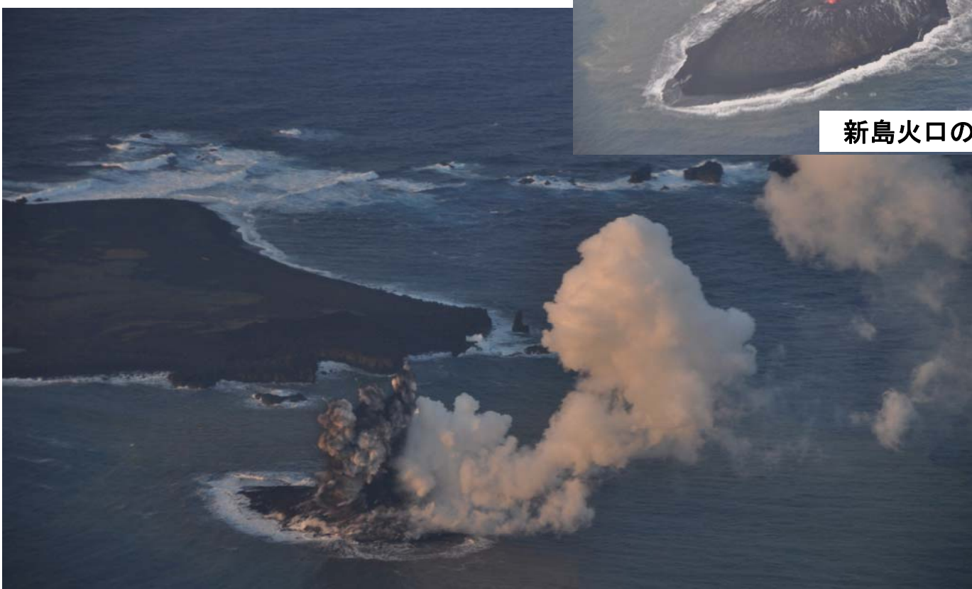
西之島(写真左)と新島から上がる噴煙の様子

11月20日(水)、小笠原諸島の海域火山である西之島の南南東約500メートル付近の海上に、直径200メートル程度の新島が出現し、黒色の噴煙を上げている様子を海上保安庁の航空機が確認しました。