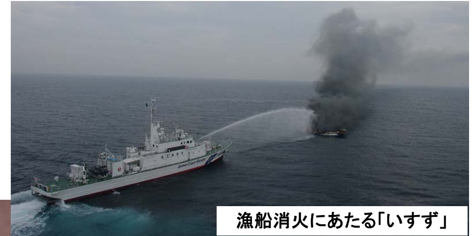
漁船消火にあたる「いすず」