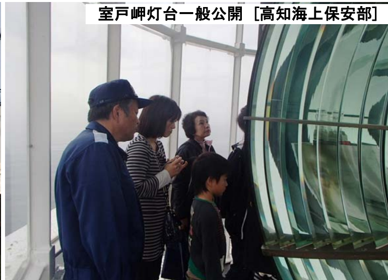
室戸岬灯台一般公開 [高知海上保安部]