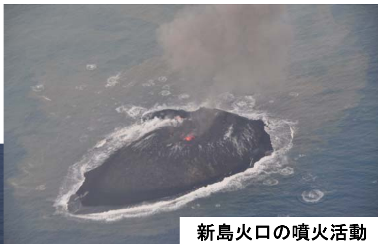
新島火口の噴火活動