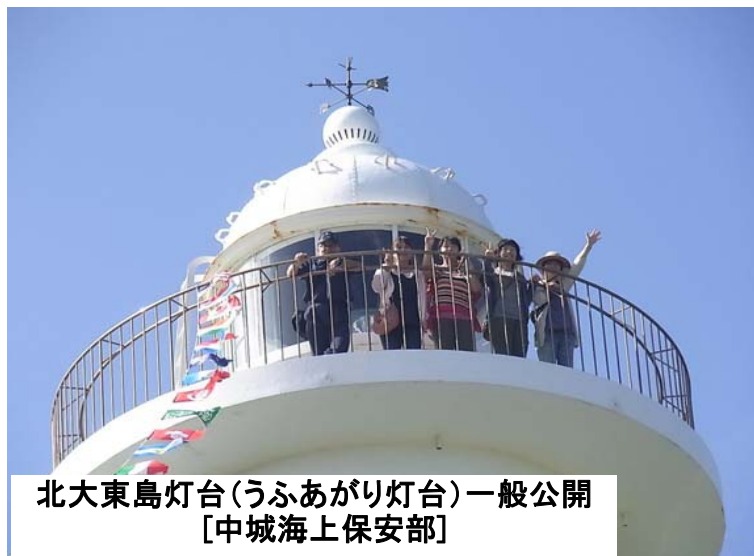
北大東島灯台(うふあがり灯台)一般公開 [中城海上保安部]