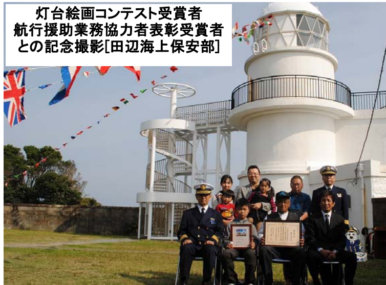
灯台絵画コンテスト受賞者 航行援助業務協力者表彰受賞者 との記念撮影