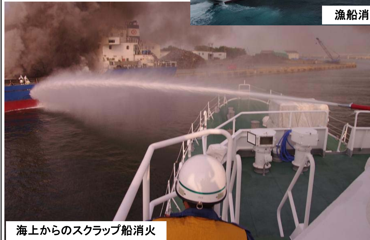
海上からのスクラップ船消火

11月2日(土)、愛知県三河港に停泊中の外国籍貨物船に積載されたスクラップから出火、延焼しているとの情報を受け、鳥羽海上保安部から巡視船「いすず」が緊急出港し対応しました。