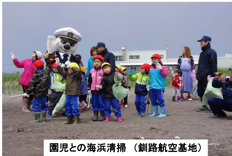
園児との海浜清掃（釧路航空基地）