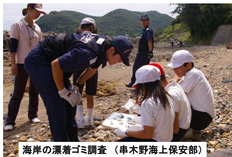
海岸の漂着ゴミ調査（串木野海上保安部）