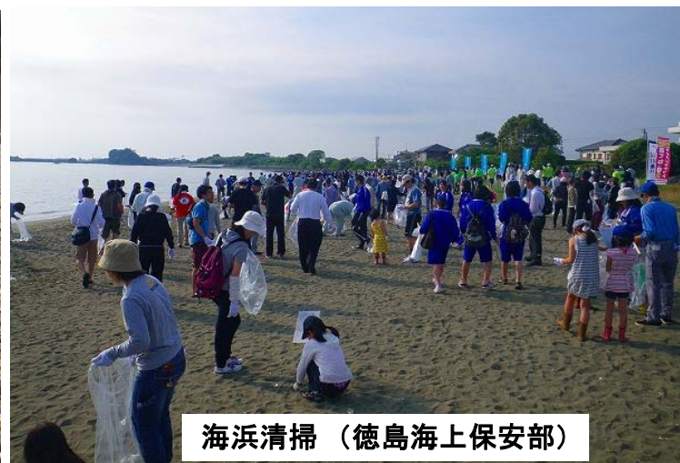
海浜清掃（徳島海上保安部）

海上保安庁では6月1日から30日までの1ヶ月間を「海洋環境保全推進月間」として、「未来に残そう青い海」をスローガンに全国各地で海洋環境保全指導・啓発活動を実施しました。「油類による汚染対策」、「廃棄物の不法投棄対策」を重点項目として海浜清掃や、海岸の漂着ゴミ調査を実施しました。