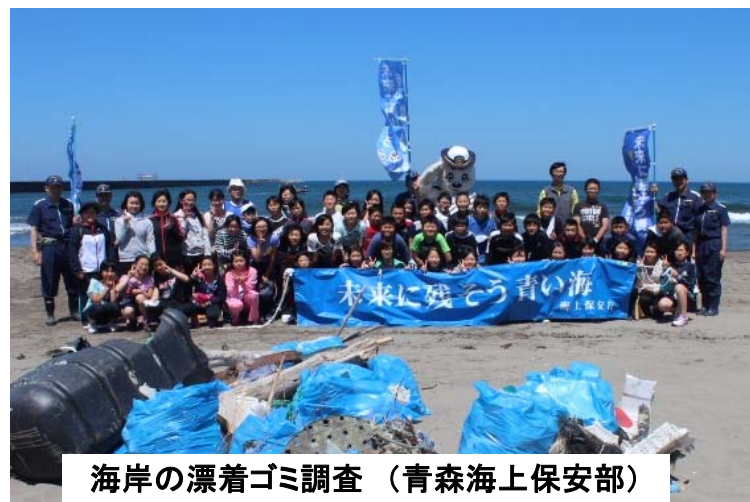
海岸の漂着ゴミ調査（青森海上保安部）