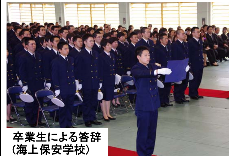
卒業生による答辞 (海上保安学校)