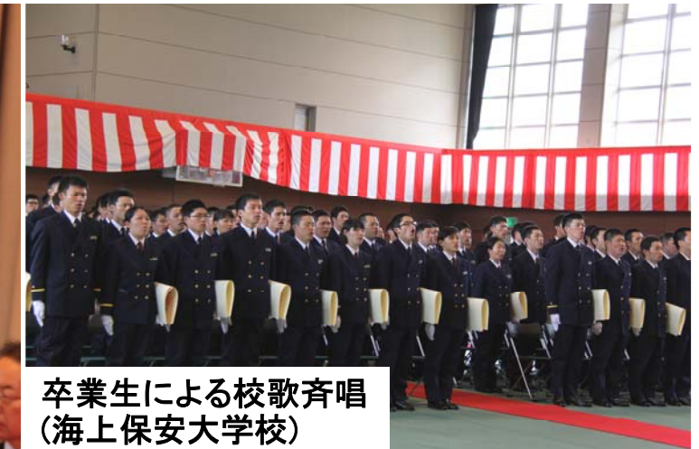
卒業生による校歌斉唱 (海上保安大学校)