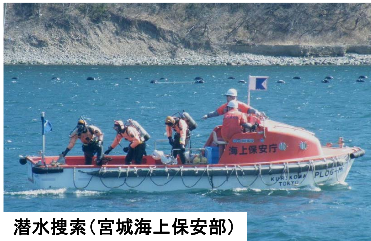
潜水搜索(宮城海上保安部)

東日本大震災から2年が経過する3月11日、第二管区海上保安本部では行方不明者の集中搜索を他機関と合同で実施しました。集中搜索では、潜水土による潜水搜索をはじめ、巡視船艇、航空機による海面、海岸線の搜索を実施する等、地元警察や消防等と協力し、幅広い範囲の搜索を行いました。海上保安庁では引き続き行方不明者の搜索を続けていきます。