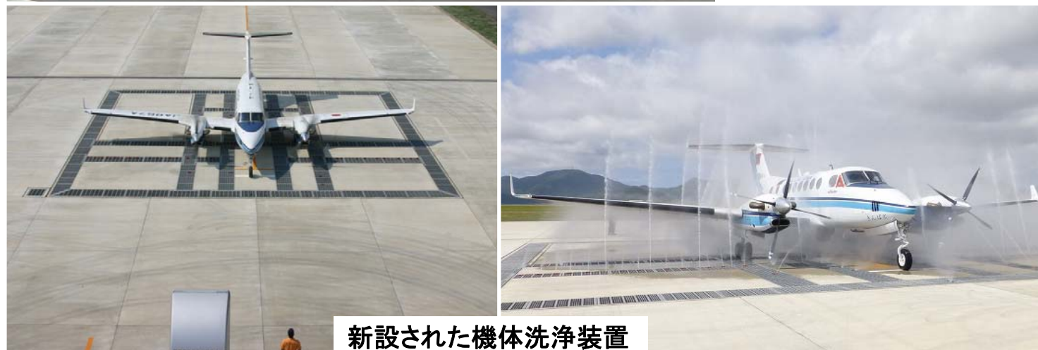
新設された機体洗浄装置

3月7日、新石垣空港の開港に伴い、隣接する石垣航空基地も新空港に移転し業務を開始しました。