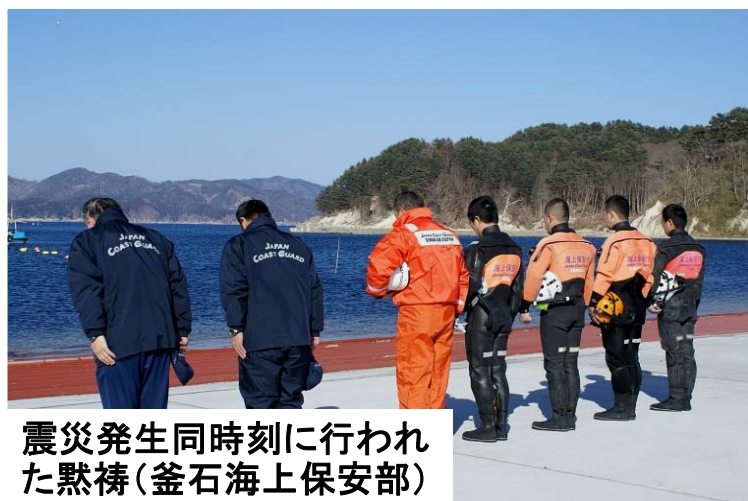
震災発生同時刻に行われた黙禱(釜石海上保安部)