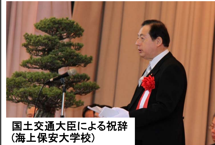
国土交通大臣による祝辞 (海上保安大学校)