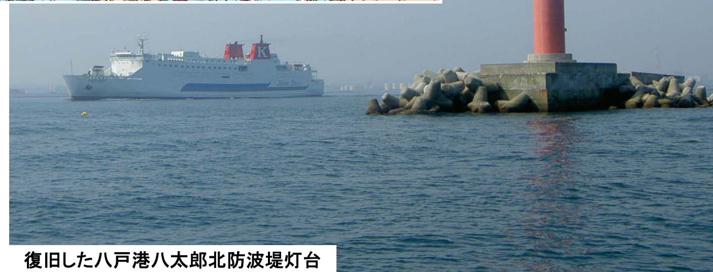
復旧した八戸港八太郎北防波堤灯台

東日本大震災の影響で使用できなくなっていた青森県八戸港八太郎北防波堤灯台が、3月11日に復旧し再点灯しました。この灯台は八戸港の中央港口に位置しており、付近を航行する貨物船やフェリーなどに港の位置を知らせる重要な役割を担っています。八戸海上保安部では未だ復旧していない八戸港白銀北防波堤灯台の再点灯を目指し、今後も復旧作業を進めていきます。