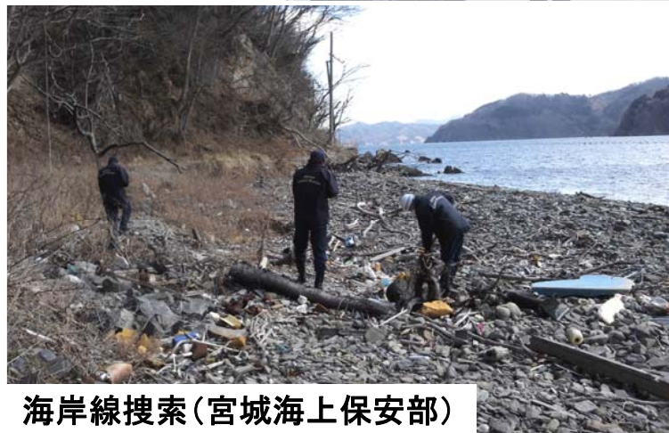
海岸線搜索(宮城海上保安部)