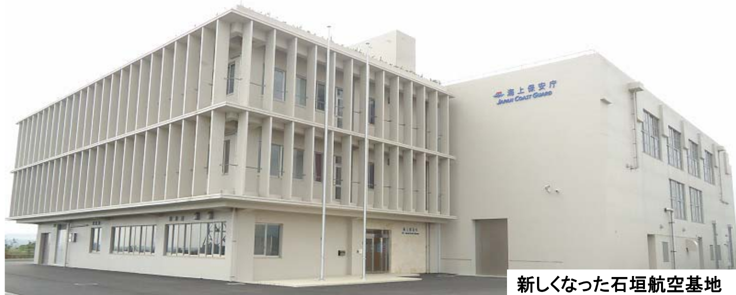
新しくなった石垣航空基地