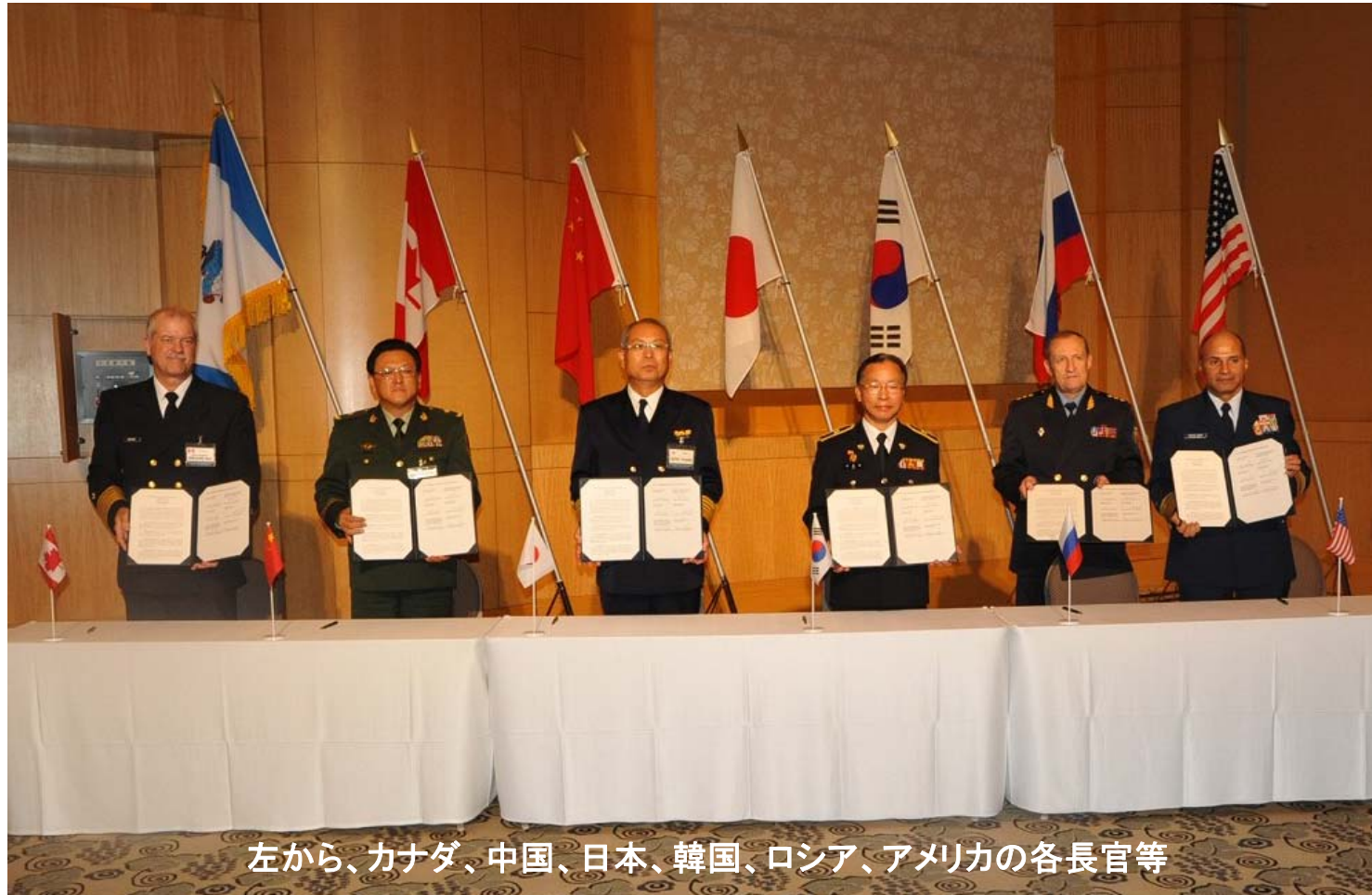
左から、カナダ、中国、日本、韓国、ロシア、アメリカの各長官等

9月12～15日の間、北太平洋地域6カ国の海上保安機関の長官級による「第12回北太平洋海上保安フォーラムサミット」が横浜で開催されました。