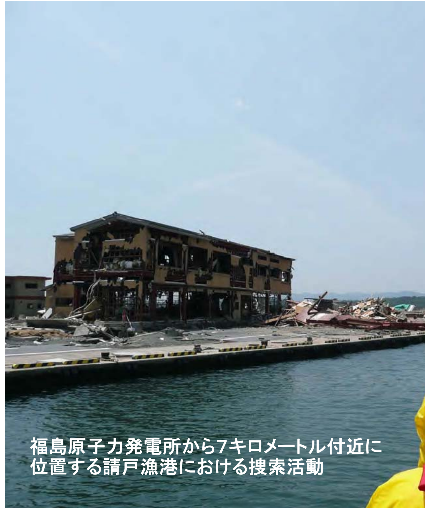
福島原子力発電所から7キロメートル付近に位置する請戸漁港における搜索活動