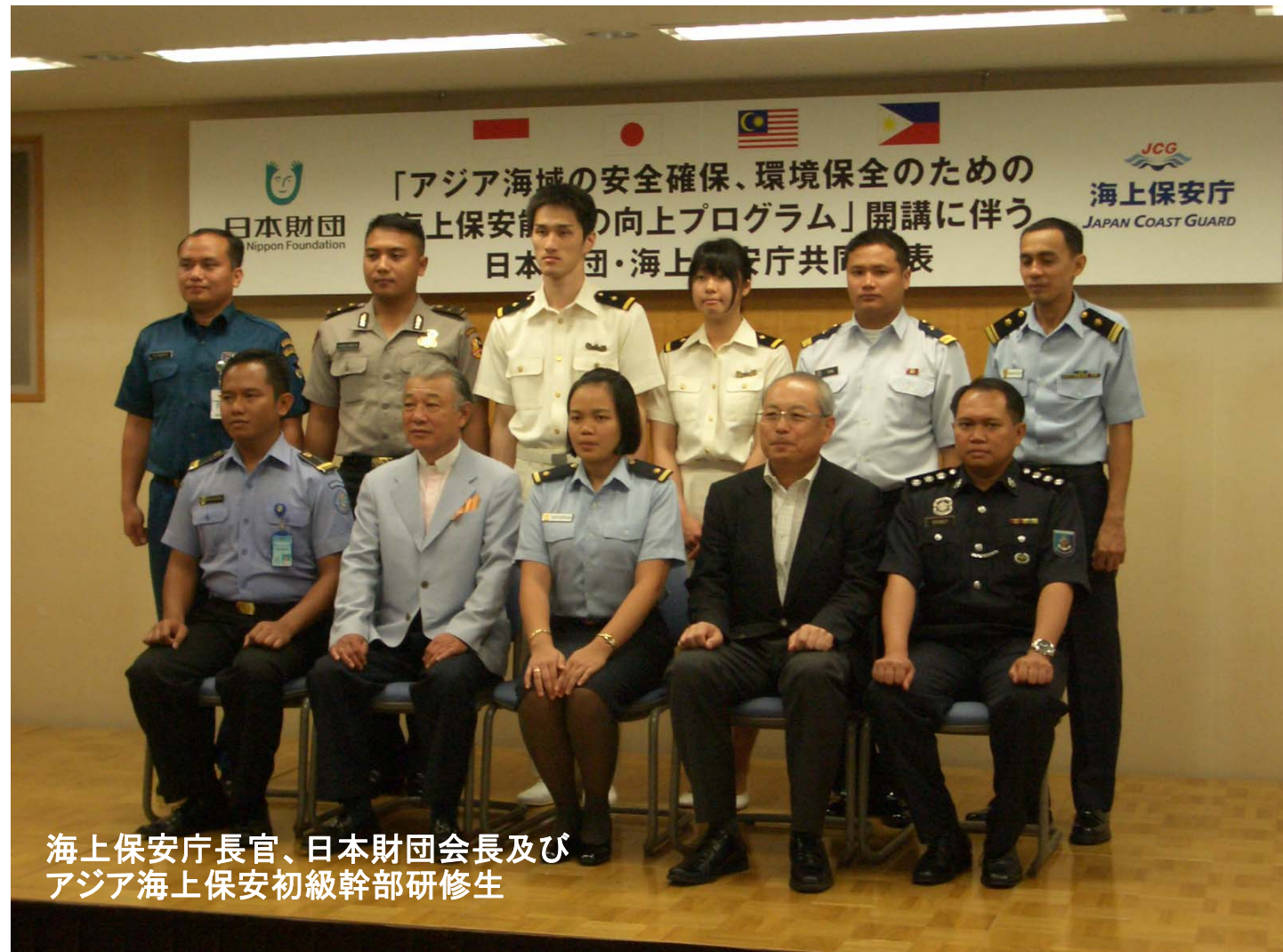
海上保安庁長官、日本財団会長及び アジア海上保安初級幹部研修生

5月9日、海上保安庁は日本財団及び(財)海上保安協会と協力し、海上保安大学校（広島県呉市）において、アジア海上保安初級幹部研修を開始しました。本研修は、海上保安庁職員を含むアジア各国の海上保安機関の初級幹部を参加させ、幅広い知見と国際的な視野を持った人材育成を行うとともに、研修員の相互理解を通じて、アジア各国海上保安機関の連携強化を図ることを目的としており、将来的には海上保安大学校がアジアの海上保安機関の人材育成の国際的な拠点となることを目指しています。