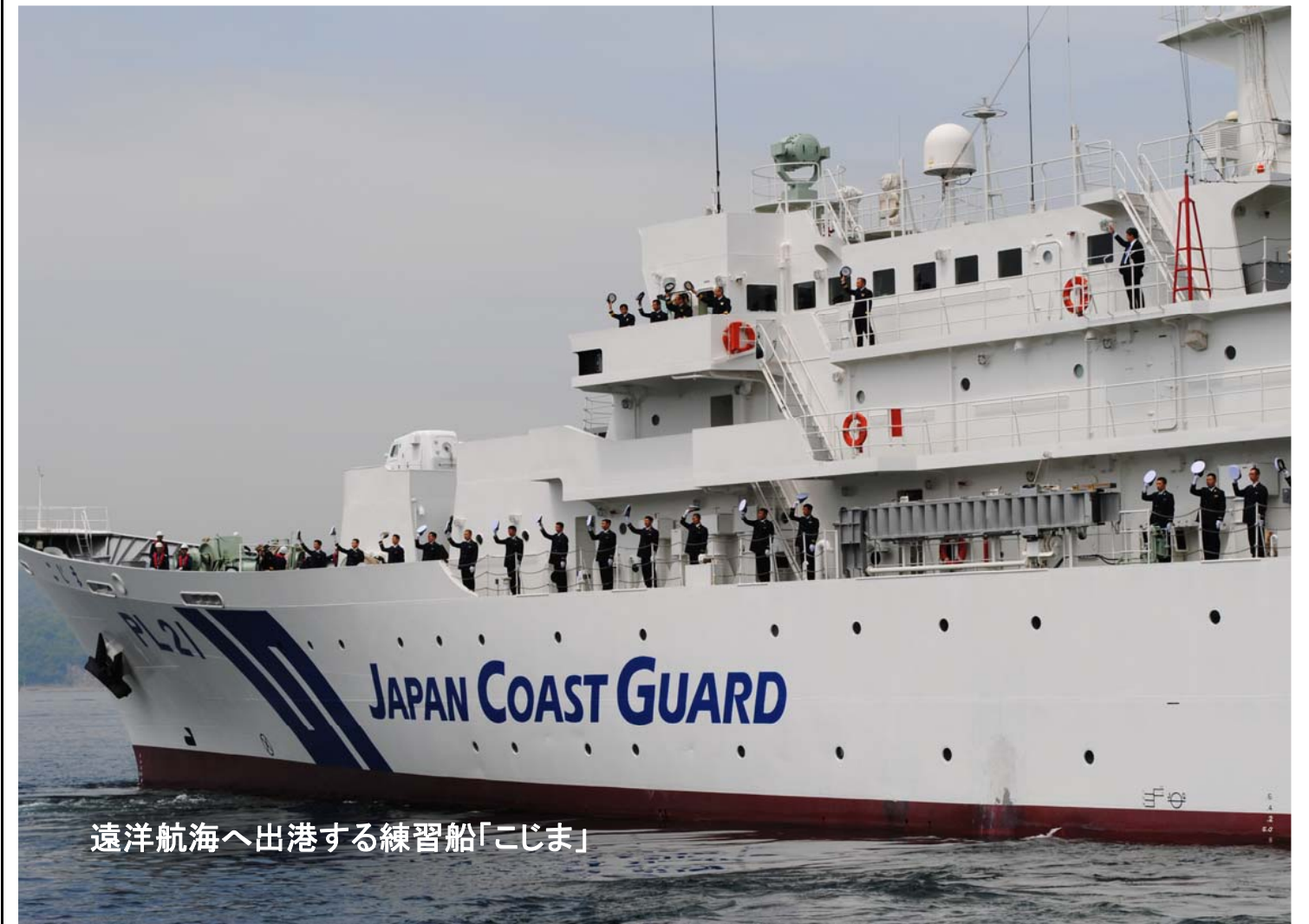
遠洋航海へ出港する練習船「こじま」

5月9日、海上保安大学校（広島県呉市）の練習船「こじま」は、総日数95日、総航程約46,300キロメートルに及ぶ世界一周の遠洋航海のため呉を出港しました。出港後はホノルル、ニューヨーク、イスタンブール、シンガポールへ寄港し、各国の海上保安機関との交流の他、洋上では訓練・実習などを行い8月11日、再び呉に帰港することになっています。実習生35名は、学生音楽隊による演奏、応援団の声援の中、見送りの方々に敬礼と帽振れで応えながら大学校棧橋を後にしました。