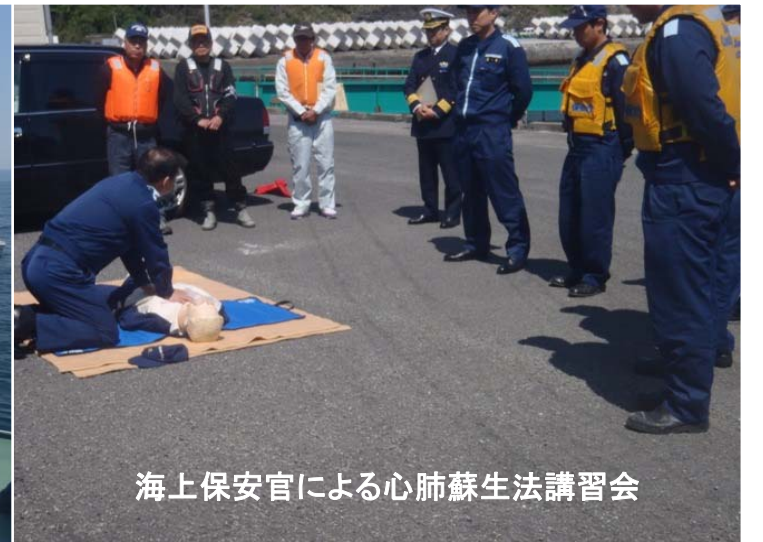
海上保安官による心肺蘇生法講習会