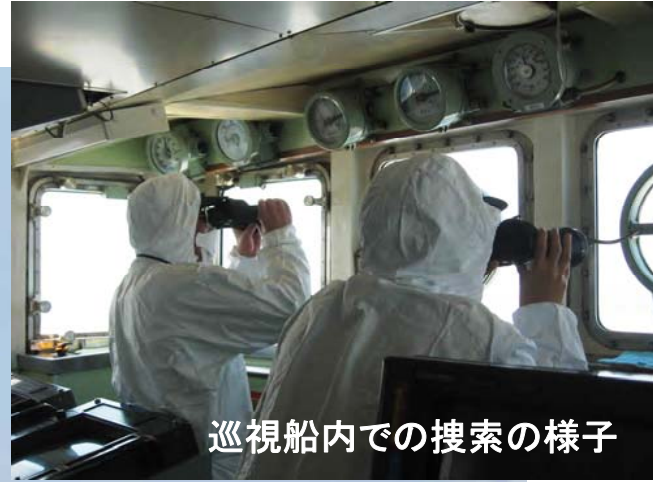
巡視船内での搜索の様子