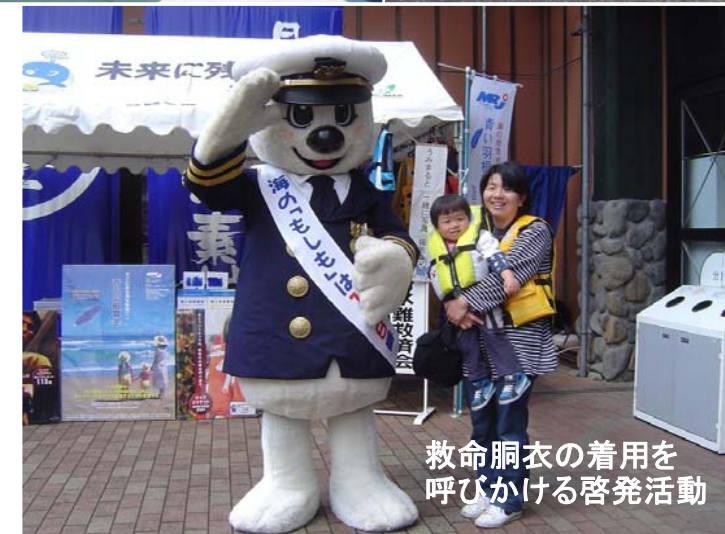
救命胴衣の着用を呼びかける啓発活動

海上保安庁では、5月16日及び25日、浪江町請戸漁港及び周辺海域（福島第一原子力発電所から10キロメートル以内）において行方不明者の搜索を行いました。同海域での搜索には放射線防護の装備が必要であるため、海上保安官は黄色や白色の防護服に身を包み行方不明者の搜索を実施しました。なお、この2日間の搜索において、行方不明者の発見には至っていません。