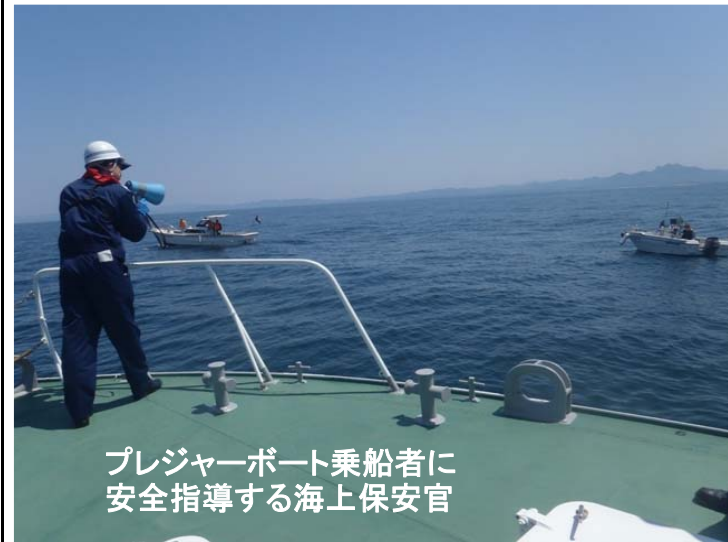
プレジャーボート乗船者に安全指導する海上保安官