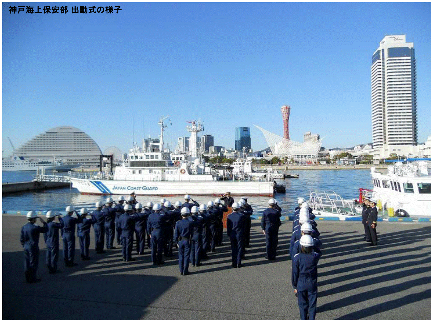
神戸海上保安部 出動式の様子

海上保安庁では年末年始の輸送繁忙期における安全確保のため、平成22年12月10日から平成23年1月10日までの間、フェリーや遊漁船、旅客ターミナルなどを対象に、年末年始特別警戒及び安全指導を実施します。