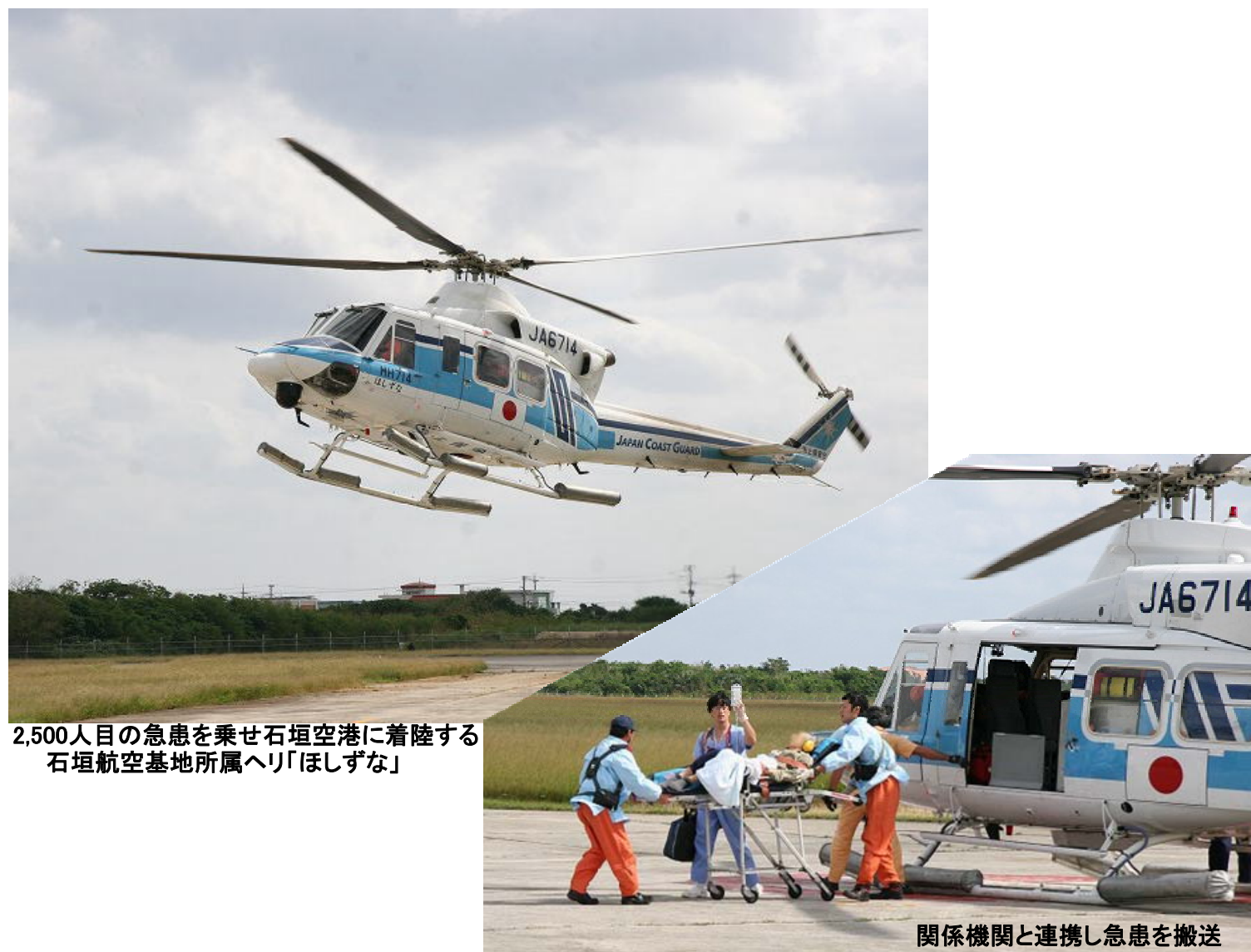
2,500人目の急患を乗せ石垣空港に着陸する石垣航空基地所属ヘリ「ほしずな」