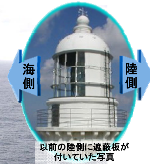
以前の陸側に遮蔽板が付いていた写真

11月1日の灯台記念日に併せ全国で様々な行事を行いました。中でも11月3日に行われた経ヶ岬灯台（京都府京丹後市）の一般公開では、初点灯以来112年間陸側を覆っていた灯光の遮蔽板を撤去、日本に5台しか現存しない巨大な第一等フレネルレンズのお披露目が行われ注目を浴びました。これは「地域や観光客により親しまれる灯台に」との要望に応えたもので、そのレンズの美しさと輝きは参観者に感動と驚きを与えました。