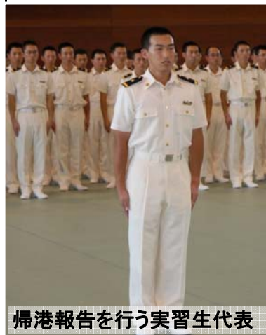
帰港報告を行う実習生代表