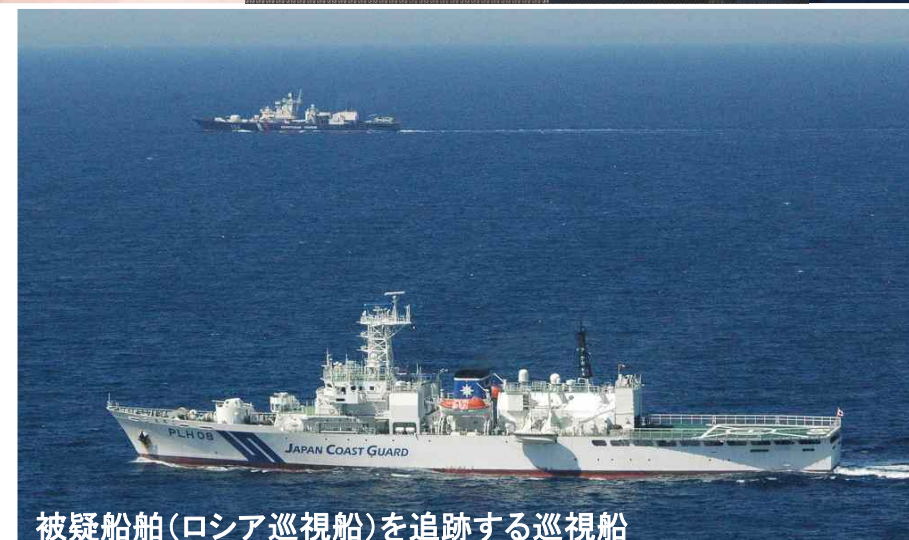
被疑船舶(ロシア巡視船)を追跡する巡視船

8月22日から25日までの間、オホーツク海及びロシア・ウラジオストック沖において、北太平洋地域6カ国（日本、カナダ、中国、韓国、ロシア、米国）の海上保安機関が、海上の秩序・治安の確保を目的とした訓練を行いました。