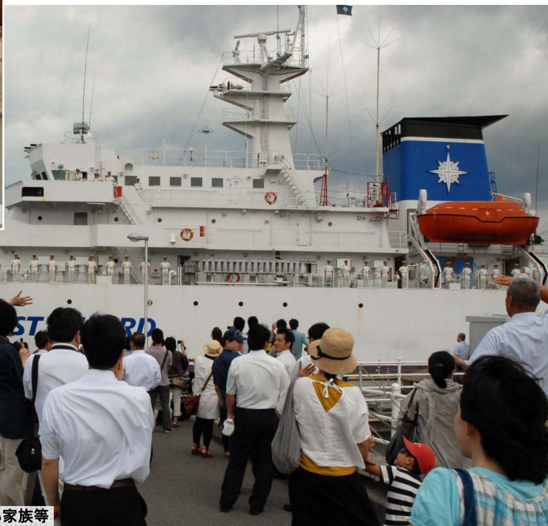
練習船「こじま」を出迎える家族等

8月12日、海上保安大学校（広島県 呉市）の練習船「こじま」が総日数95日、総航程約45,000キロメートルにおよぶ世界一周の遠洋航海を終え、無事呉に帰港しました。