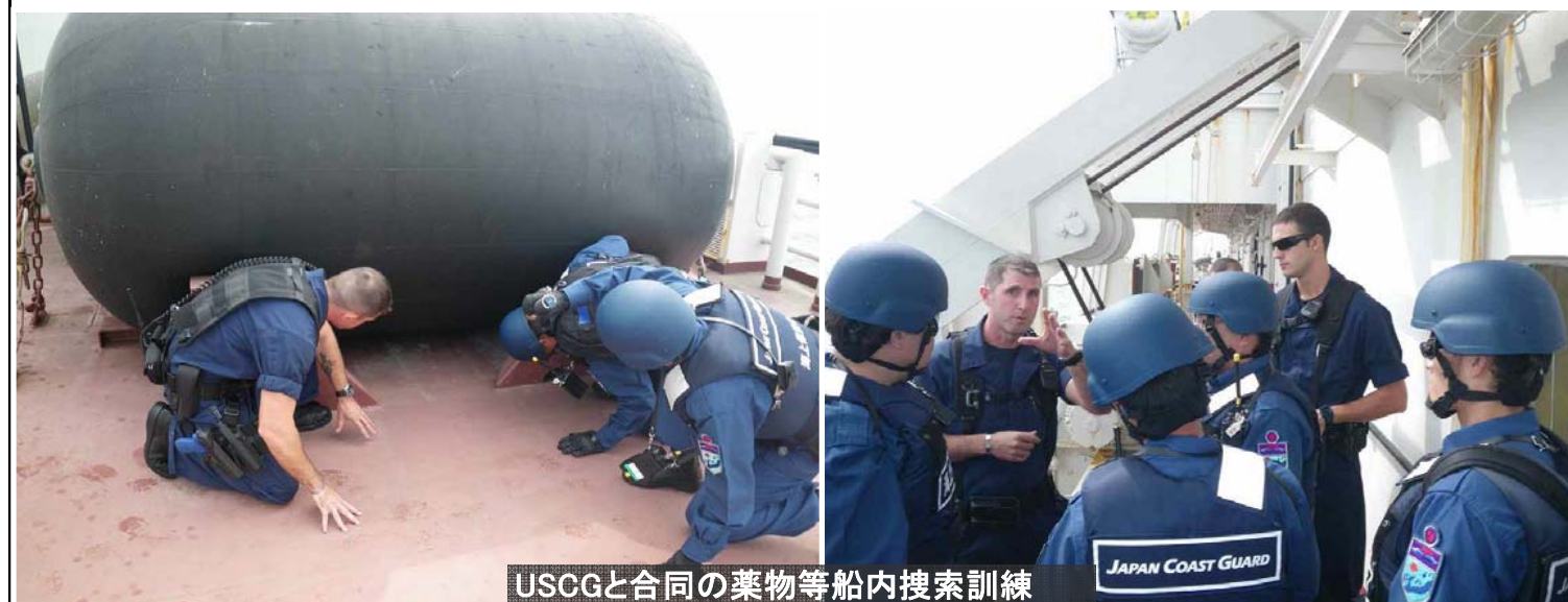
USCGと合同の薬物等船内捜索訓練