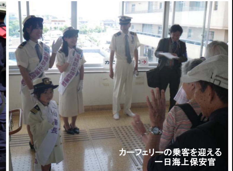
カーフェリーの乗客を迎える 一日海上保安官