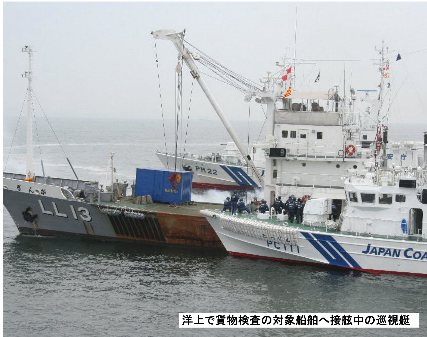
洋上で貨物検査の対象船舶へ接舷中の巡視艇

7月4日、「国際連合安全保障理事会決議第千八百七十四号等を踏まえ我が国が実施する貨物検査等に関する特別措置法」（貨物検査法）が施行されました。