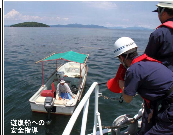
遊漁船への 安全指導