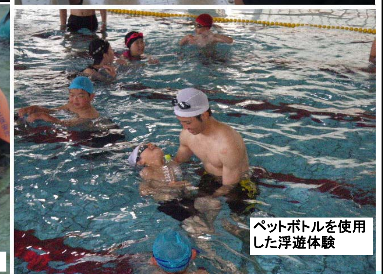
ペットボトルを使用 した浮遊体験

7月16日から31日までの間、「海難ゼロ」をスローガンに、官民が一体となった「全国海難防止強調運動」を実施しました。期間中、全国で海事関係者やプレジャーボート愛好家へ見張りの強化やライフジャケットの着用など海難防止を呼びかけたほか、夏休み中、マリンレジャーを楽しく安全に遊ぶために人命救助・自己救命策確保の指導などが行われました。