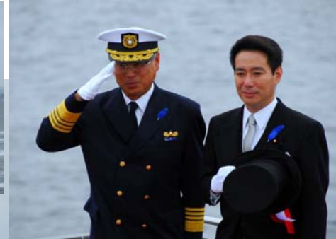
観閲を行う前原誠司国土交通大臣と 鈴木久泰海上保安庁長官