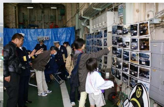
「118」ナンバーの車をあつめた写真展示