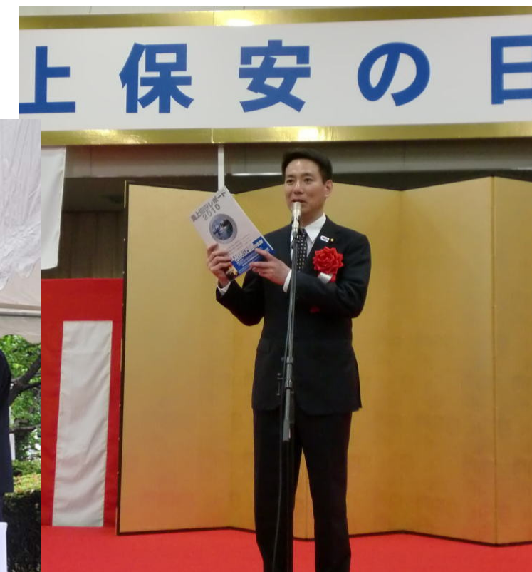
海上保安の日祝賀会 前原誠司国土交通大臣挨拶

平成12年5月1日に運用を開始した海上保安庁緊急通報用電話番号「118番」が、平成22年5月1日で10周年を迎えました。