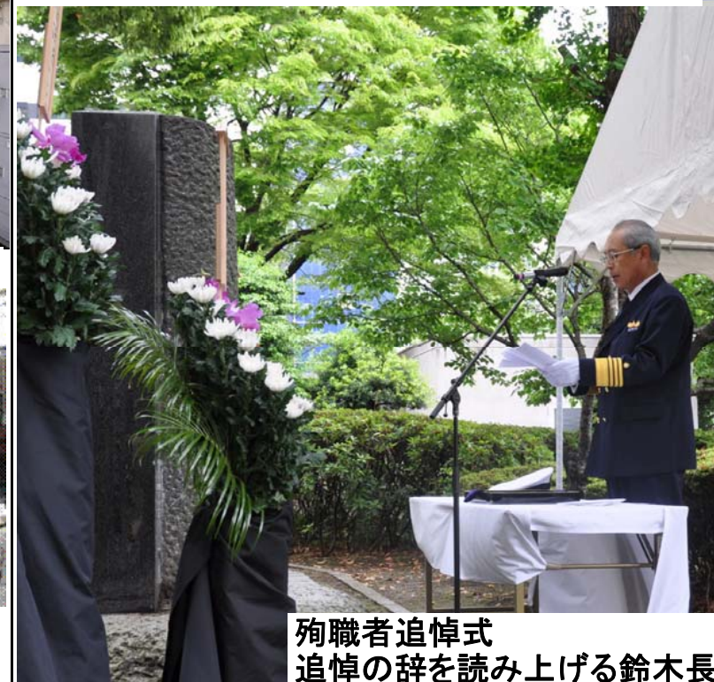
殉職者追悼式 追悼の辞を読み上げる鈴木長官