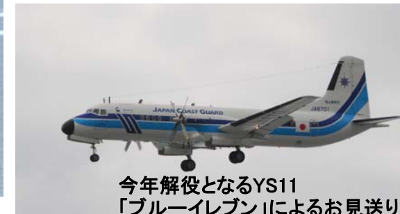
今年解役となるYS11 「ブルーイレブン」によるお見送り