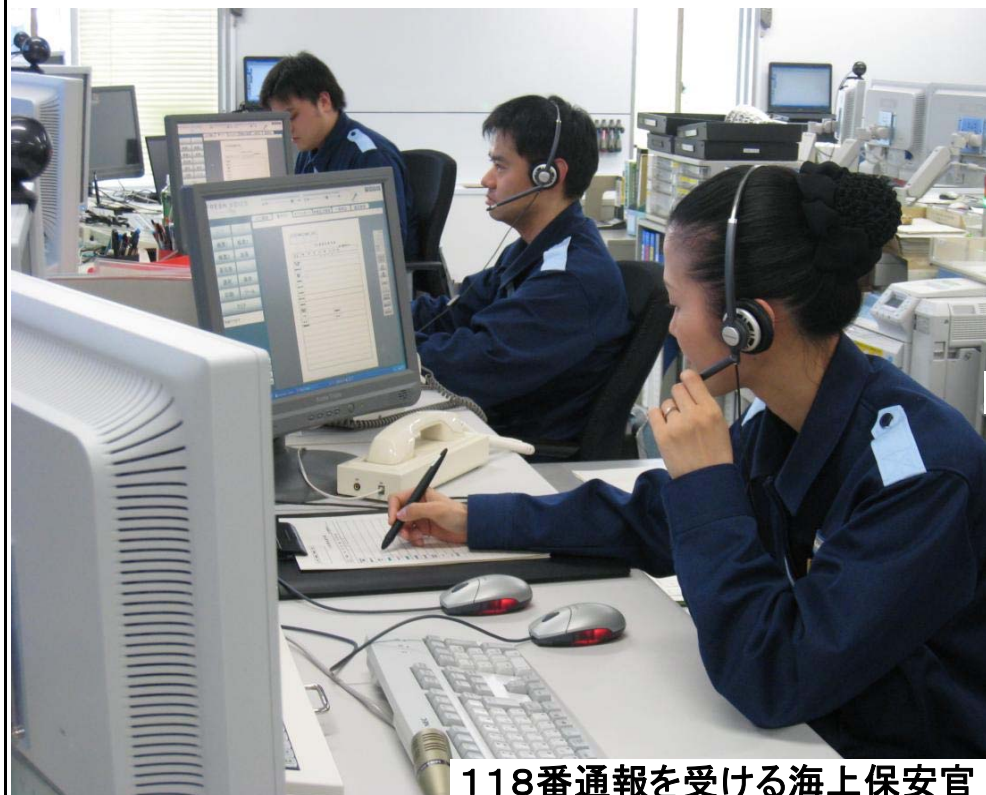
118番通報を受ける海上保安官