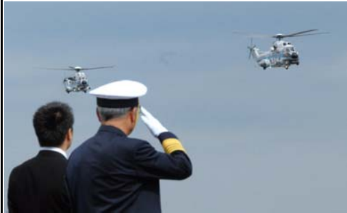
航空機による観閲式