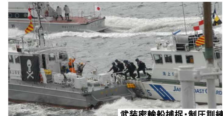
武装密輸船捕捉・制圧訓練