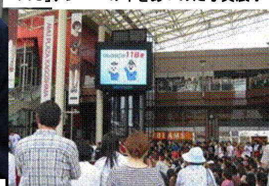
街頭大型ビジョンによる「118」PR