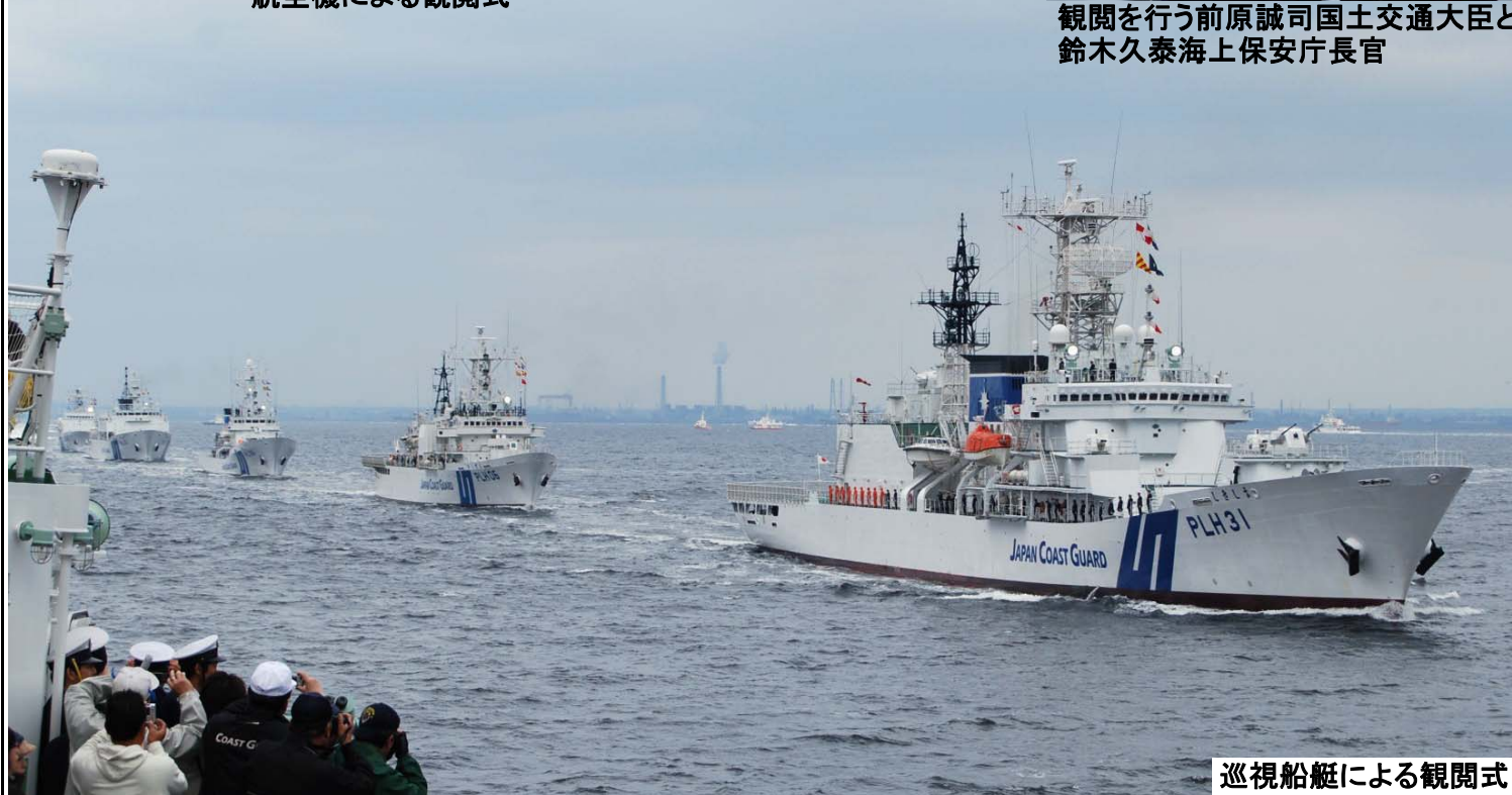
巡視船艇による観閲式