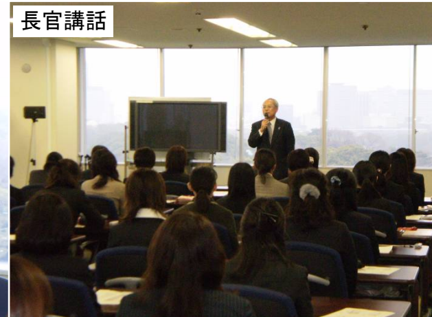
研修に参加した女性職員