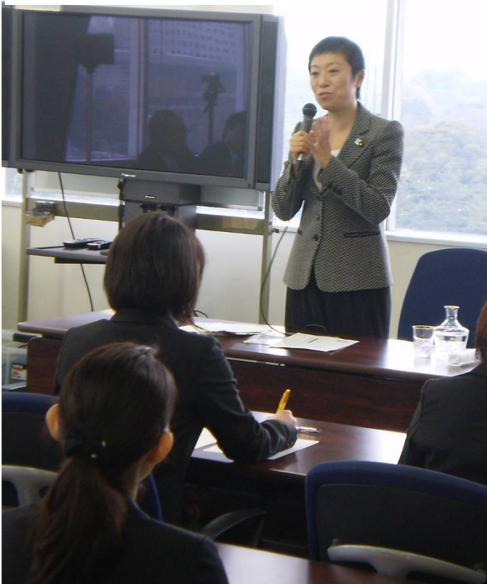
辻元清美国土交通副大臣による講話