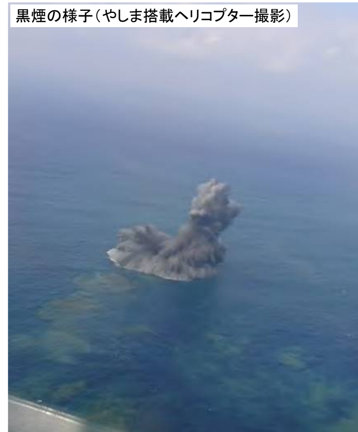
黒煙の様子