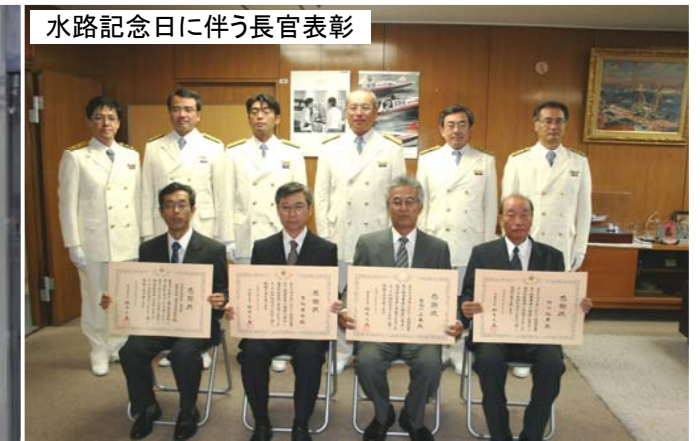
水路記念日に伴う長官表彰