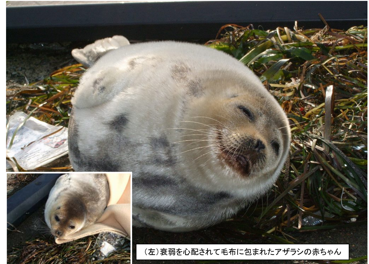
(左)衰弱を心配されて毛布に包まれたアザラシの赤ちゃん

1月21日、根室港内で犬の散歩をしていた一般市民の方から、「波打ち際付近のスロープ上で子供のアザラシを見つけた。弱っているかもしれないので助けてやってほしい。」という通報が根室海上保安部にあり、職員が現場に急行しました。お母さんとはぐれた迷子の赤ちゃんアザラシは、衰弱している可能性もあったため、鳥獣保護を担う北海道根室支庁に連絡し、その後一旦は海に帰しましたが、翌日になってもその場を去らなかつたため、同支庁を通じ釧路市動物園に保護してもらうことになりました。