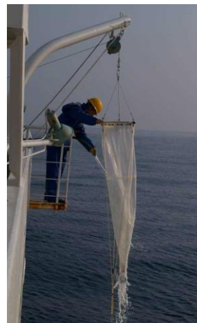
プランクトンネット （ノルパックネット（動物プランクトン））