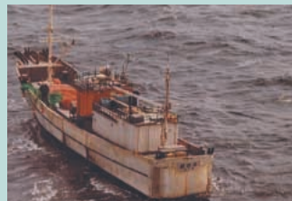
● No10. 昭和55年3月11日 京都府経ヶ岬沖