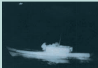
● No15. 昭和55年6月11日 兵庫県香住町余部埼沖