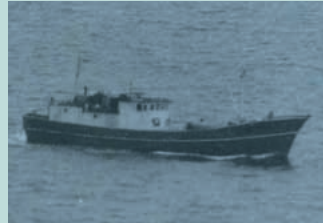
● No4. 昭和46年8月27日 北海道江差港沖