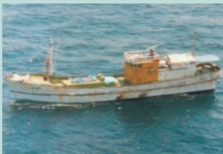
● No14. 昭和55年5月17日 長崎県対馬神崎沖