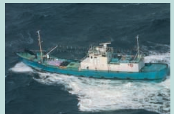
● No21. 平成13年12月22日 鹿児島県奄美大島沖(長漁3705)