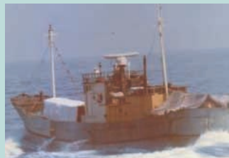
● No8. 昭和52年7月23日 福岡県沖ノ島沖