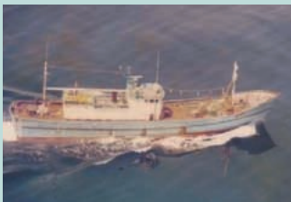
● No7. 昭和50年6月14日 石川県猿山岬沖