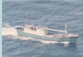
● No3. 昭和46年8月26日 青森県鱸作埼沖