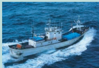
● No19. 平成11年3月23日 石川県能登半島沖(第二大和丸)