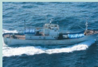
● No20. 平成11年3月23日 石川県能登半島沖(第一大西丸)