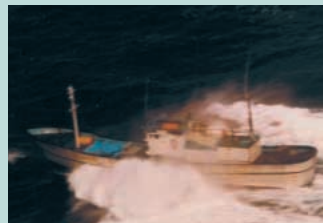
● No16. 昭和56年8月6日 石川県舩倉島沖