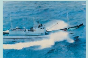
● No17. 昭和60年4月25日 宮崎県鶴戸埼沖(第三十一幸菜丸)