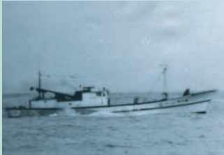
● No2. 昭和45年4月14日 兵庫県城崎郡竹野町切浜沖

漁業者からの通報により巡視船が山形県酒田市十里塚海岸沖約1キロメートルにて無灯火の不審船を発見、追跡するも停止命令に応じず逃走。