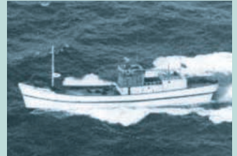
● No5. 昭和46年10月2日 鹿児島県揖保郡穎姓町馬渡海岸沖