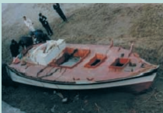
● No18. 平成2年10月28日 福井県三方郡美浜久々子海岸