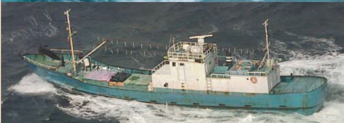
「長漁3705」(平成13年12月22日)