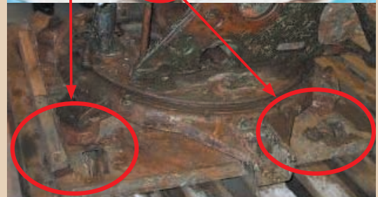
二連装機銃台座の車輪