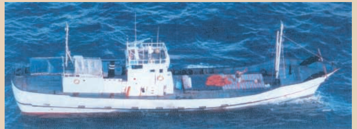
「第十二松神丸」(平成10年8月7日)