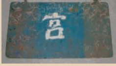
船尾の船籍港表示