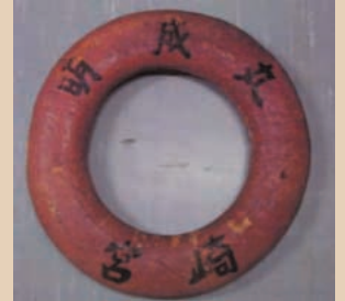
「明成丸」と記載の救命浮輪