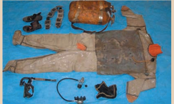
潜水用具及び防水スーツ