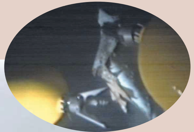
マニピレーターを操作する模様