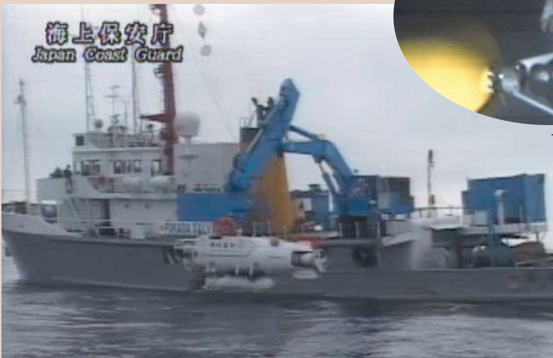
有人潜水艇が海中に入る状況