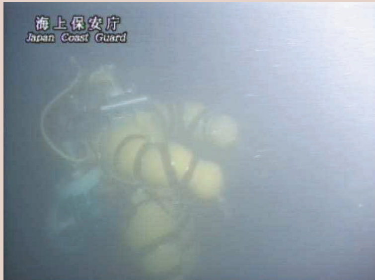
海中で調査中の大気圧潜水士