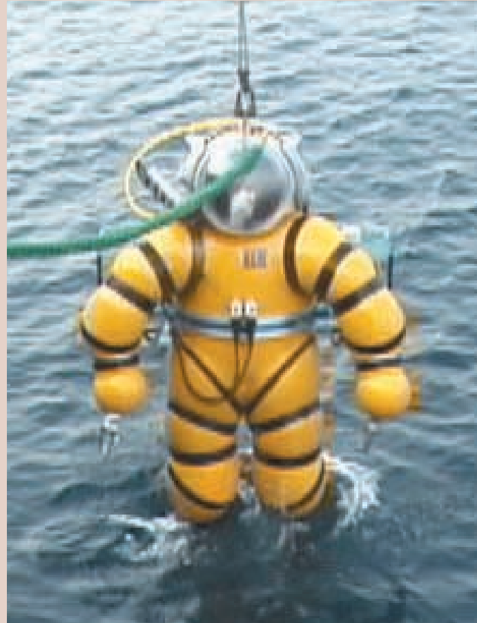
大気圧潜水士が海中に入る状況