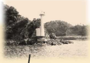
三角港荷島灯台 (みすみこうにいじま) 昭和37年12月8日 初点 白色 塔型 コンクリート造 地上から頂部まで9.3m 平均水面上から灯火まで12.0m 群閃白光 毎6秒に2閃光 光達距離3.5海里