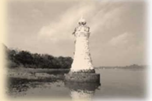
寺島灯台 (てらしま) 明治31年5月10日 初点 白色 塔形 石造り 地上から頂部まで11.0m 平均水面上から灯火まで10.3m 単閃白光 毎3秒に1閃光 分弧 赤光で白瀬を示す 光達距離3.5海里