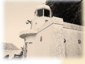
三角灯台 (みすみ) 明治23年3月1日 初点 白色 塔型 コンクリート造り (平成元年に修築) 地上から頂部まで6.6m 平均水面上から灯火まで40.0m 群閃白光 毎7秒に2閃光 光達距離12海里