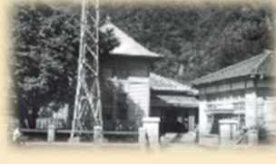
海上保安部は昭和43年まで西港に置かれていた。