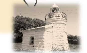
戸馳島灯台 (とびせしま) 明治31年5月10日 初点 白色 塔形 石造り 地上から頂部まで8.2m 平均水面から灯火まで33.0m 単閃白光 毎4秒に1閃光 光達距離7.5海里