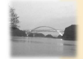
天門橋 天城橋にも県が管理する橋梁標識 (海上保安庁許可標識) が設置されている。