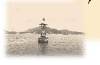
三角港白瀬西灯浮標 (みすみこうしらせにし) 昭和36年12月12日 初点 赤色円すいすい浮標1個付 赤色 やぐら形 水面から灯火まで4.5m モールス符号赤光 毎8秒にA (・―) 光達距離4.0海里