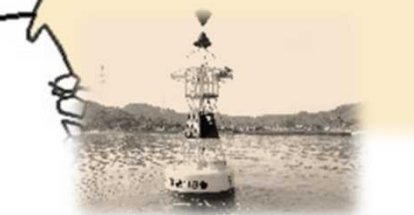
三角港網取瀬西灯浮標 (みすみこうあみとりせにし) 昭和40年11月21日 初点 黒色円すいすい浮標2個 (縦線 頂点対向) 付 黄地に黒横帯1本塗 やぐら形 水面から灯火まで4.5m 群急閃白光 毎15秒に9急閃光 光達距離4.0海里