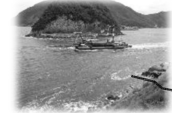
三角瀬戸は最大4ノットの潮流がある。