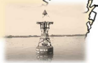
三角港エマチノ瀬灯浮標 (みすみこうえまのせ) 昭和24年7月20日 初点 赤色円すいすい浮標1個付 赤色 やぐら形 水面から灯火まで4.2m 単閃赤光 毎3秒に1閃光 光達距離4.0海里