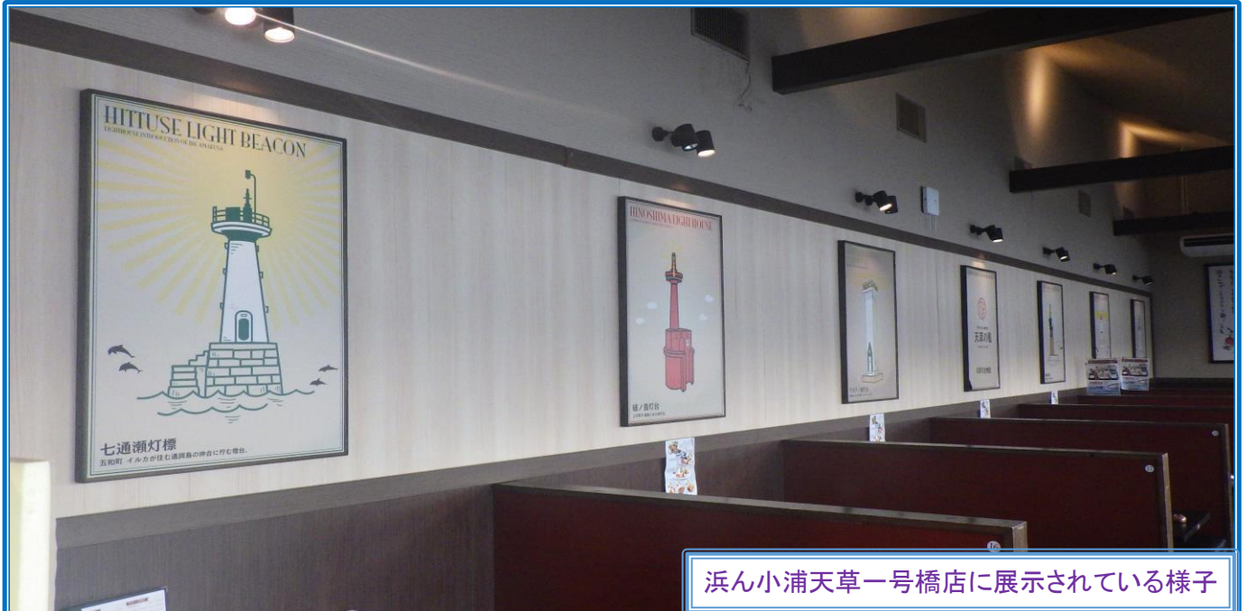
浜ん小浦天草一号橋店に展示されている様子