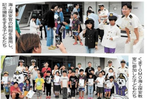
海上保安官の制服を用いた記念撮影する子どもたち

犯人は? 指紋採取も体験 「海の警察」といわれる海上保安官。海で発生した事件や事故の捜査も担います。子どもたちは鑑識作業の一つ、犯人を特定する手掛かりとなる指紋の採取も体験しました。 空き瓶や空き缶に指を押し付けて自ら作った「痕跡」。刷毛を使って、アルミニウム粉末をばたばたと付けます。それを専用のシートに写し取り、黒い台紙に貼り付けると指紋が浮かび上がりました。 「不思議!」「きれいに採取するのむずかしいな」「これで犯人を特定するなんて…」子どもたちは終始興味津々でした。