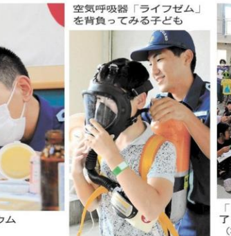
空気呼吸器「ライフゼム」を背負ってみる子ども