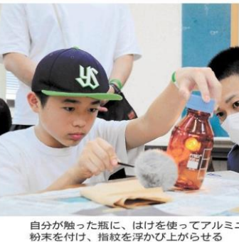
自分が触った瓶に、はけを使ってアルミニウム粉末を付け、指紋を浮かび上がらせる