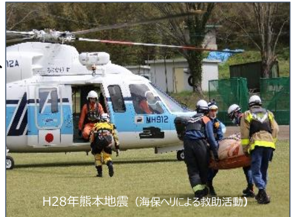
H28年熊本地震（海保ヘリによる救助活動）

熊本の例では、平成28年4月に発生した熊本地震において、熊本港、三角港、八代港に大型の巡視船を入港させ、給水、給食、入浴支援などを行うとともに、航空機を使用し、支援物資の輸送や孤立者・負傷者の搬送を行いました。災害による被害で道路や鉄道が使用できない場合に、船や航空機による支援活動は大変効果があります。また、令和2年7月の熊本豪雨の際には、被災地域は主に内陸部でしたが、ヘリコプターと機動救難士により孤立者の救助に従事しました。海上保安庁は、日頃から、海難が発生した場合にはヘリコプターにより漁船などの小型船から負傷者を吊り上げ救助をしており、その技術と装備は災害時にも応用することができます。