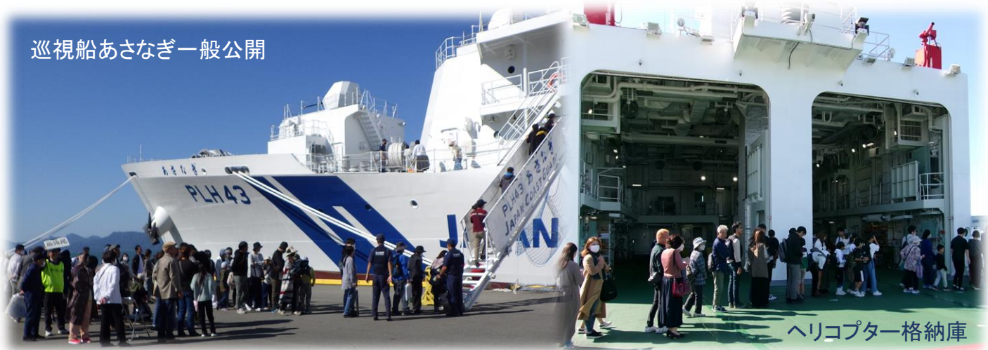
巡視船あさなぎ一般公開