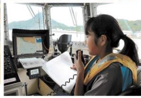
巡視艇(ひかせ)の操縦室、船内