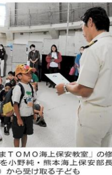
「くまTOMO海上保安教室」の修了証を小野純・熊本海上保安部長(右)から受け取る子ども