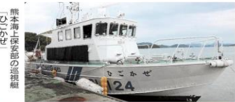
熊本海上保安部の巡視艇