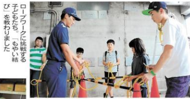
ロープワークに挑戦する 子どもたち。「もやい結 び」を教わりました