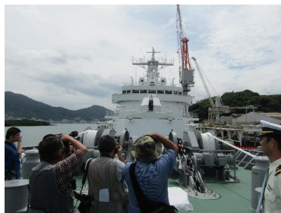
巡視船みずほ船内見学風景