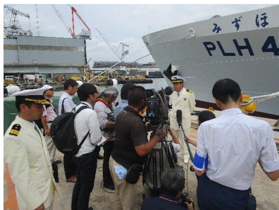
巡視船みずほ船長のインタビュー風景