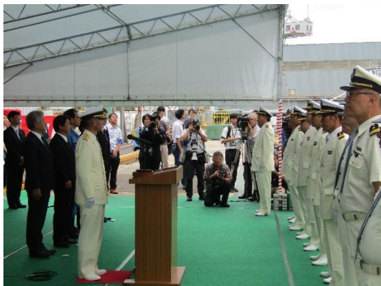
引渡式(海上保安庁長官訓示風景)