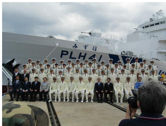
集合写真撮影風景