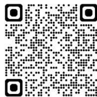
【プレジャーボート】