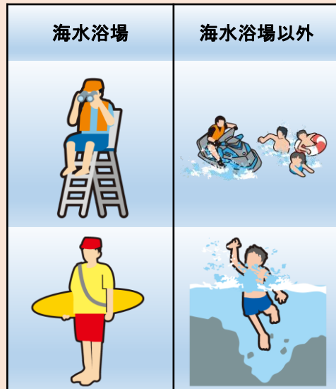
過去5年間における遊泳中の事故者数(遊泳場所別)