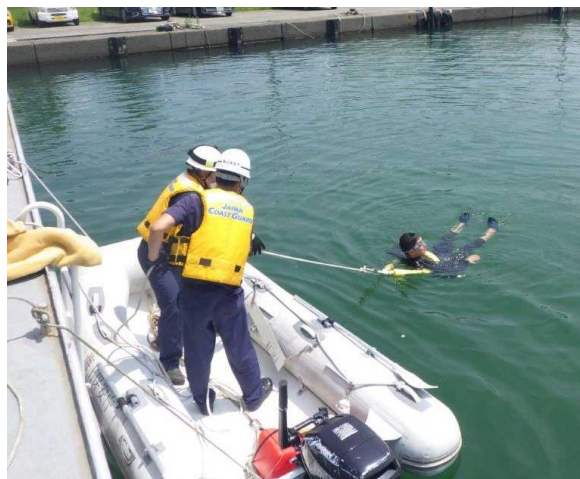
あんしんやを使用した救助（一例）