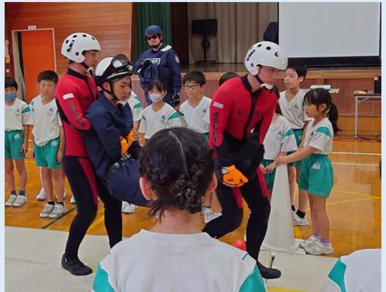
搬送法の展示 “エッホ、エッホ”

海上保安官が敦賀市立黒河小学校に出向き、4、5年生(47人)に水難事故防止等出前教室を実施しました。