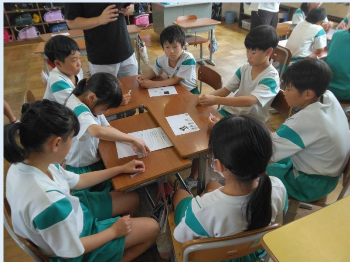
汚染調査（パックテスト） “どんどん色が変わっていくなあ”