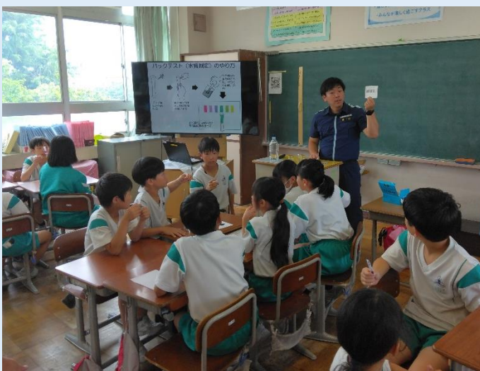
青い海を守る “ちょっとの汚れで魚が住めなくなるよ”