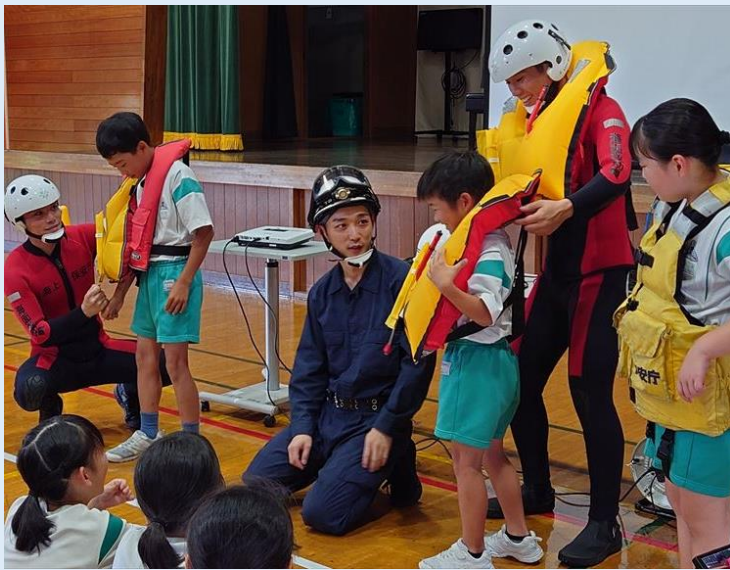
救命胴衣着用体験 “パンパンに膨らんでる…”