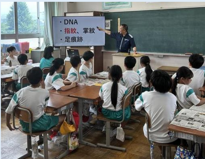
お仕事紹介 “海の上の事件を捜査します”