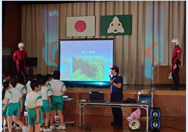
海の安全〇×クイズ “ガンガゼは…危険生物！”