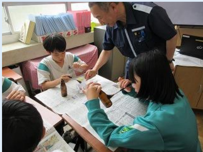
鑑識（指紋採取） “事件の解決には君の技が必要なんだ”