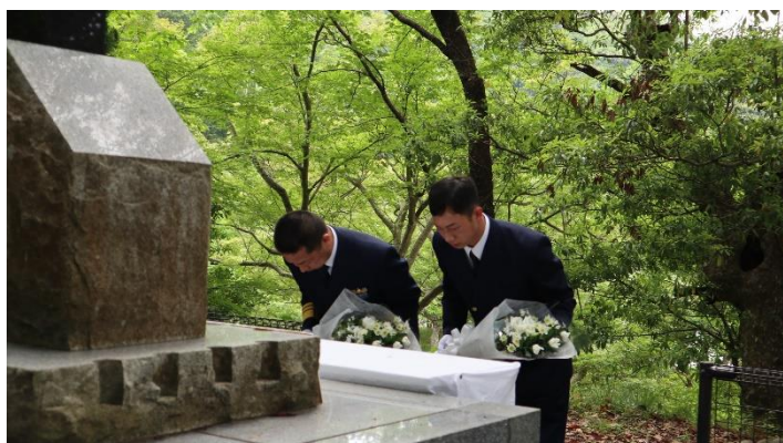
令和5年殉職者追悼式の状況