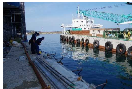
事故現場と作業台船

令和4年8月、浜田海上保安部は島根県浜田市浜田港内で岸壁工事を行っていた潜水士が作業台船と岸壁の間に挟まれ、死亡した事件につき、作業責任者等を業務上過失致死で検挙しました。