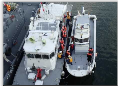
船での負傷者搬送