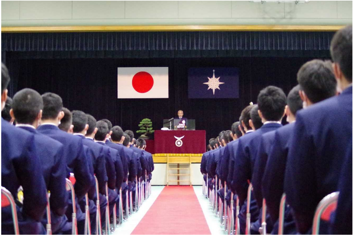
(写真は令和3年4月 入学式)