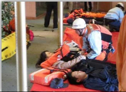
船内でのトリアージ訓練