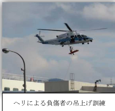
ヘリによる負傷者の吊上げ訓練