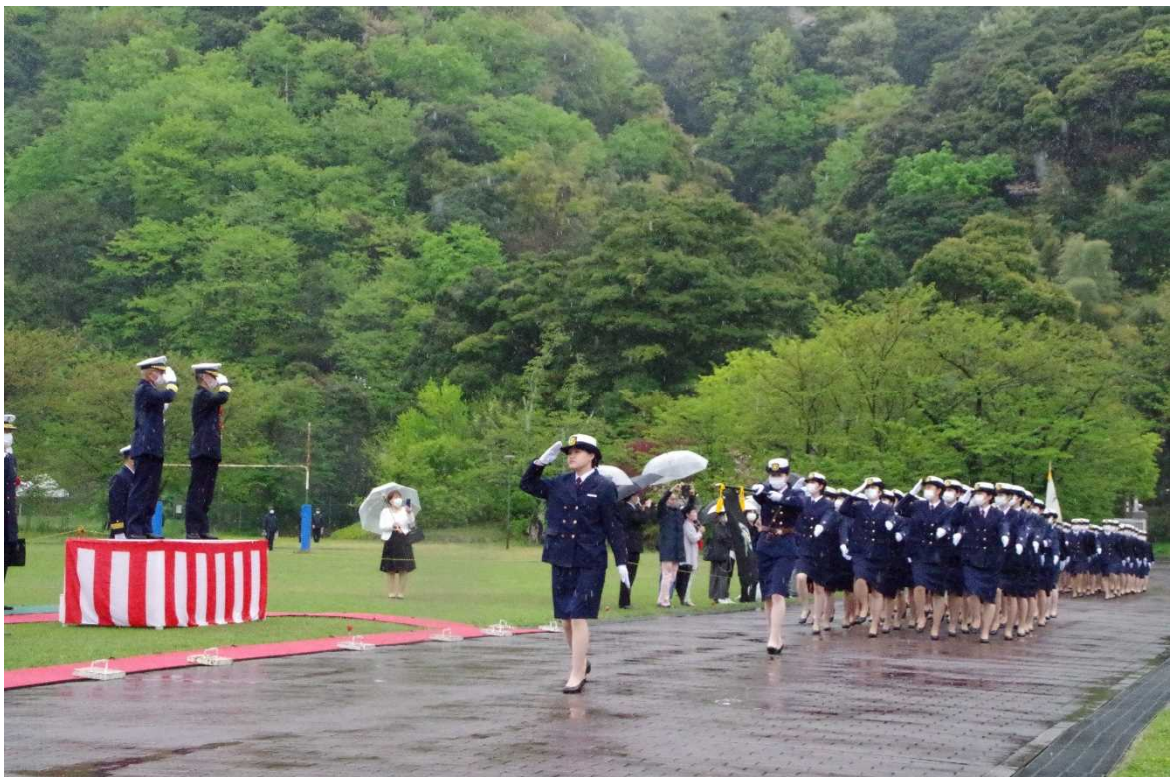
(写真は令和3年4月 学生分隊行進)