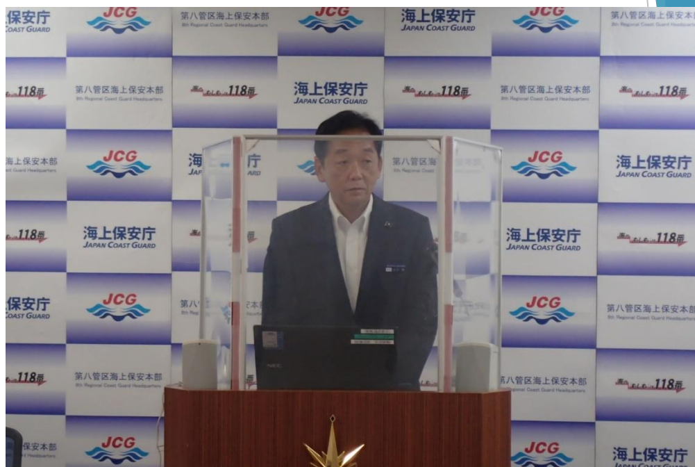
本部長挨拶の様子