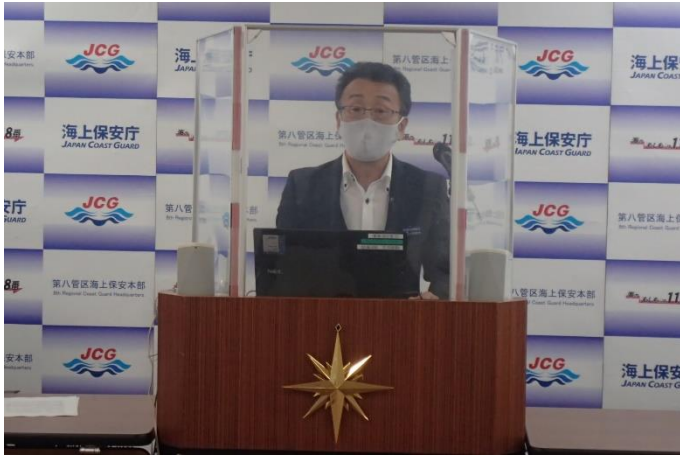
海洋情報部長による発表の様子