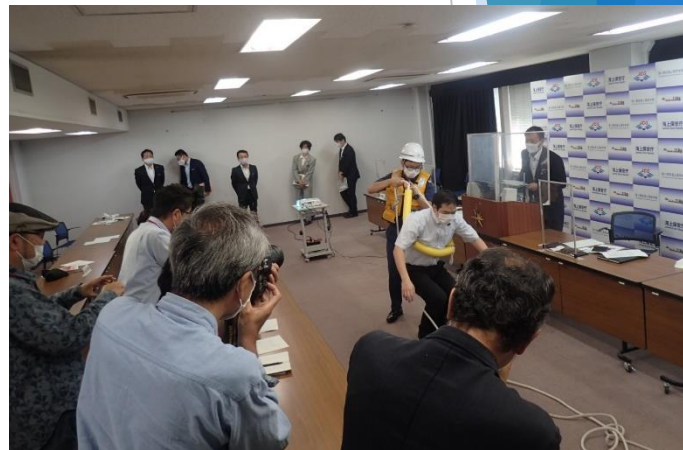
あんしんや使用方法説明