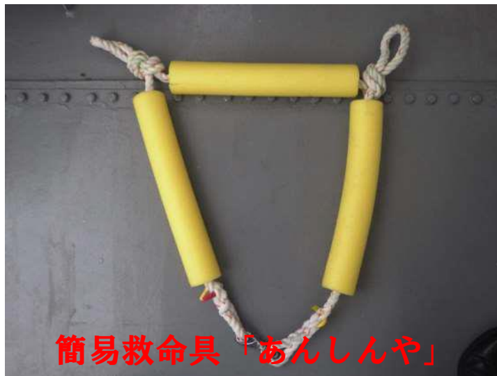
簡易救命具「あんしんや」

令和2年9月29日(火)、「9月本部定例記者懇談会」を舞鶴港湾合同庁舎第一会議室において開催しました。