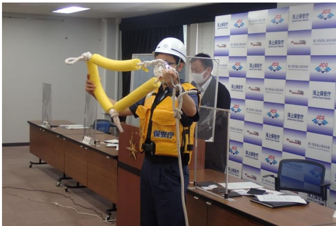
簡易救命具「あんしんや」