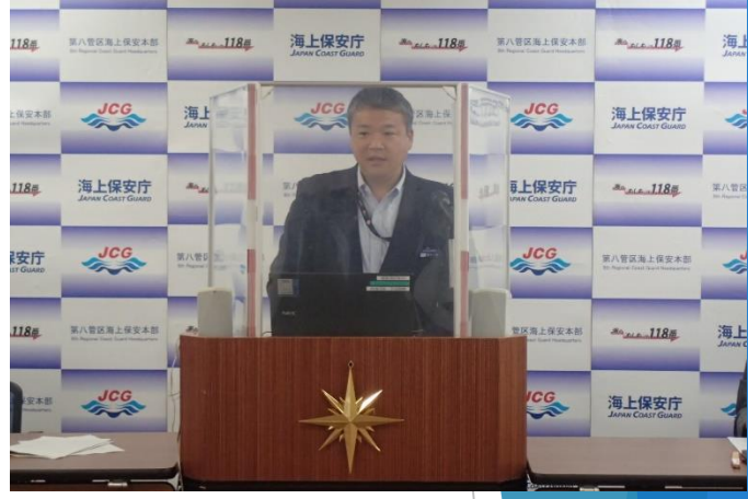
交通部長による発表の様子