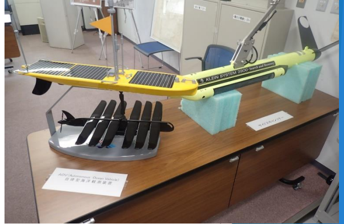
「自立型海洋観測装置 (AOV)」 (左) 「サイドスキャンソナー」 (右)