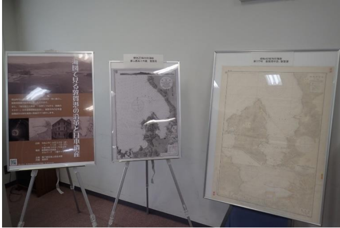
敦賀港新旧海図等の展示