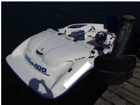
バッテリー上がりとなった事故船舶

平成30年7月23日（月）、京都府伊根町沖で漂泊中のプレジャーボート船長から、エンジンを回そうとしたがかからないので救助願う旨の118番通報があり、水難救済会所属船により救助された。