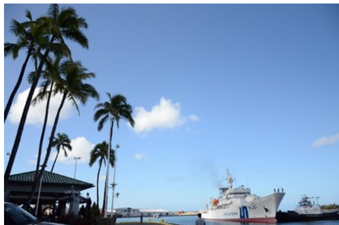
② ホノルル港に入港した練習船「こじま」