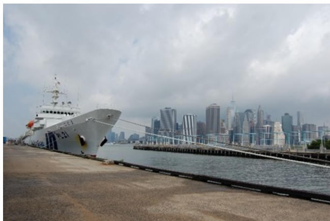
③ ニューヨーク港に入港した練習船「こじま」