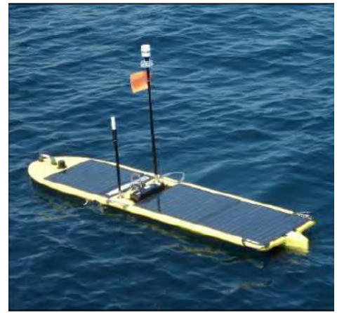
観測中の AOV (海面上)