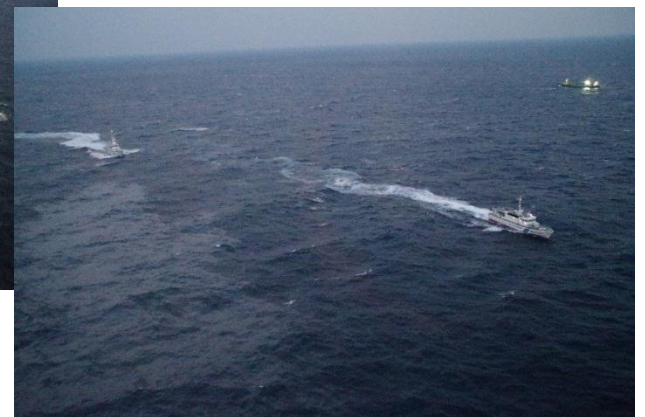
行方不明者捜索の状況