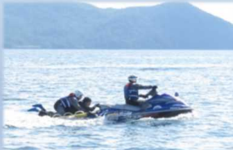
海中転落者救助訓練

何れの訓練においても、各機関真剣に取り組んでいただき、目的であるマリンレジャー関係団体の救助技術向上と各機関間の連携強化を図ることが出来ました。