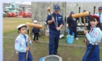
元気よく餅をつく様子

寒さに負けず元気な子供たちと一緒に餅をつき、海洋少年団との交流を一層深めました。