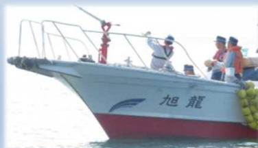
近距離もやい銃発射訓練