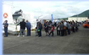
一般公開前の長蛇の列