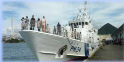
巡視船ちくご一般公開