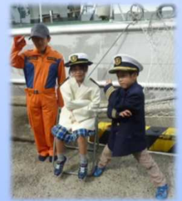
制服試着会コーナー