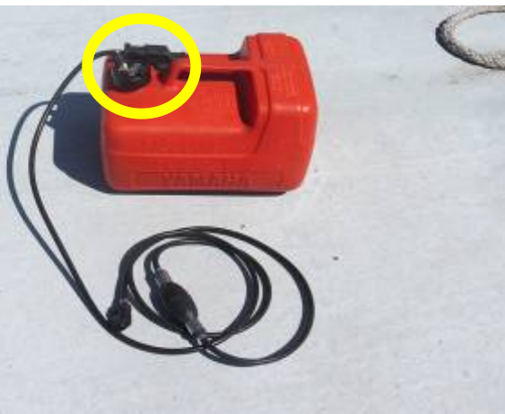
燃料タンク(小型船用)