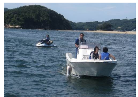
航行不能となった水上オートバイの救助の様子

これらの事例は、航行不能になることから、海域や気象条件によっては、死亡・行方不明事故に直結することになります。