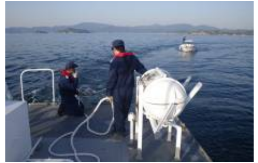
機関故障したPBを曳航中の巡視艇

頻繁に船を利用している人ももちろんですが、久しぶりに船に乗る方は、必ず発航前には船体、機関の綿密な点検を行い、十分な試運転を行いましょ。また船に乗っている間は、航行中はもちろん、釣りなどを楽しまれている間もしっかり周囲の見張りの励行をしましょ。