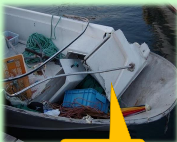
衝突により船首が破損したA丸網

汽船A丸は平成29年4月初旬の午前8時頃、大分県内の船溜りを船長1名乗組みで出港、沖合いに錨泊して魚釣りを開始、午後3時30分頃、自船に接近するエンジン音が聞こえましたが、相手船が避けるだろうと思い、相手船を良く確認することなく、魚釣りを続けていたところ、自船船首に相手船船首が衝突しました。衝突によりA丸は船首甲板が破損、脱落し、船長は負傷しました。