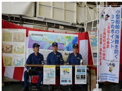
安全啓発活動を実施するために機中の安全指導員

さて第七管区海上保安本部では、ゴールデンウィーク期間中（4月29日（土）から5月7日（日）の9日間）、マリンレジャー活動が活発化し、海浜・海域での事故の発生が予想されることから、管内各地で、安全推進運動を実施しました。