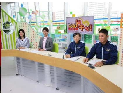
地元ケーブルテレビに出演しGW安全推進活動の周知活動