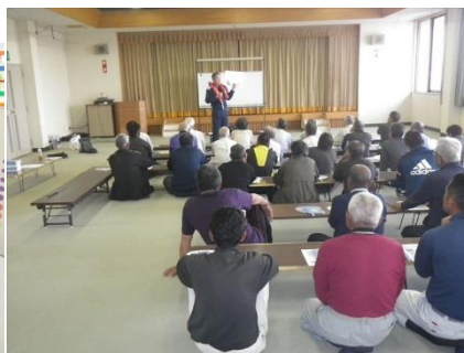
免許更新時における海難防止講習