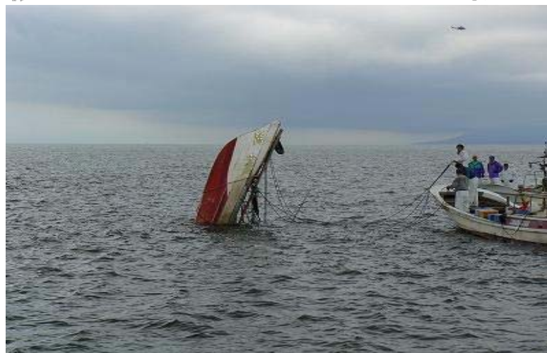
曳航救助中、半没した状況