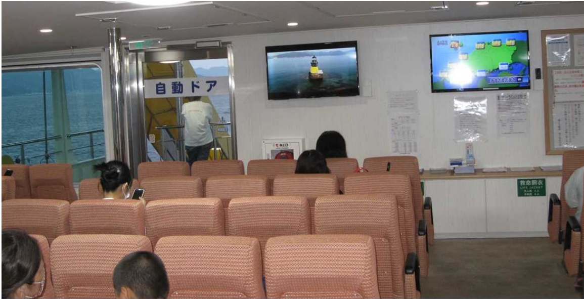
船内モニターで放映（広島～江田島）