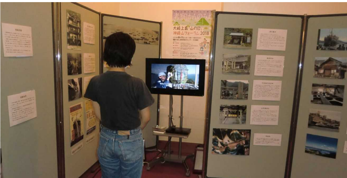
ホテル（大崎上島町）ロビーで放映