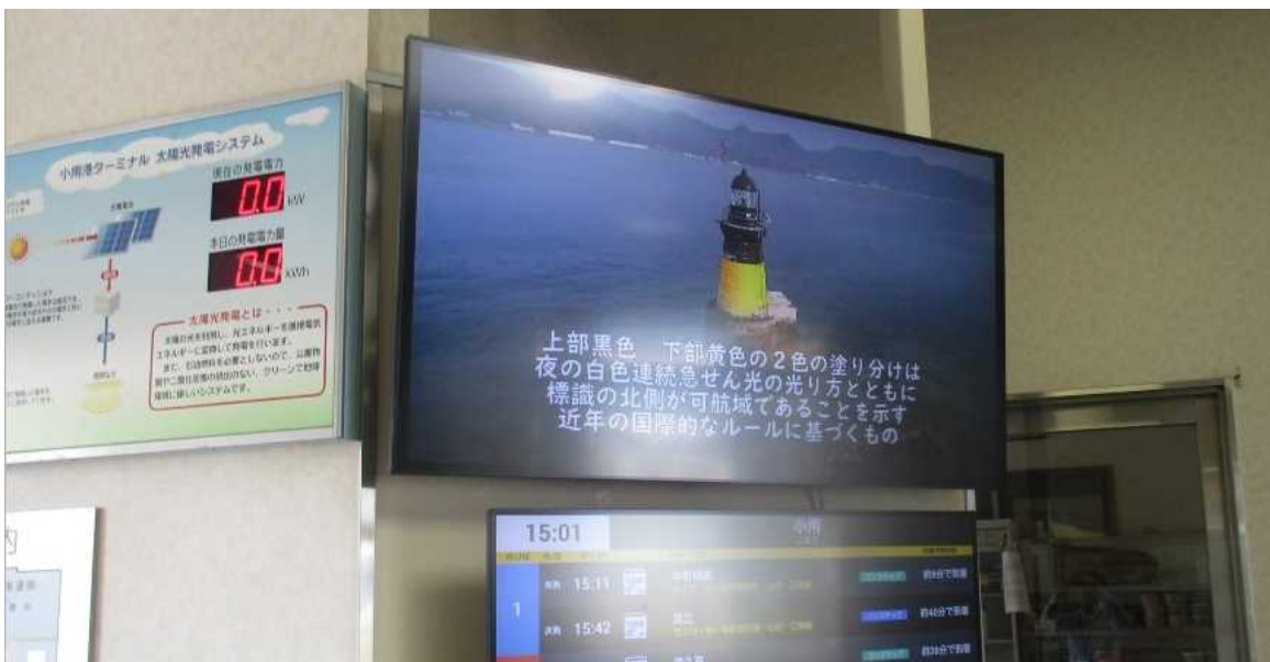
小用港ターミナル（江田島市）の待合室で放映