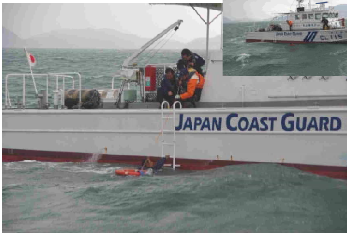
【救助中の巡視艇いまかぜ】